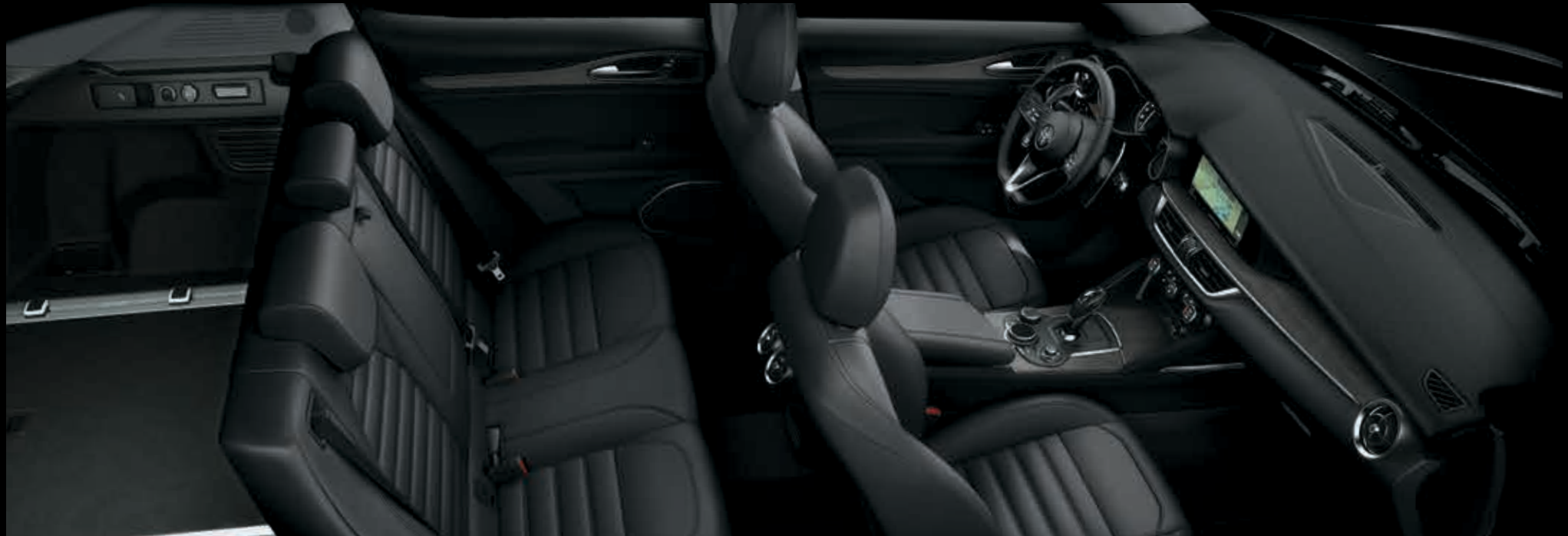
Černý přístrojový panel s obložením z šedého dubu – černá kůže