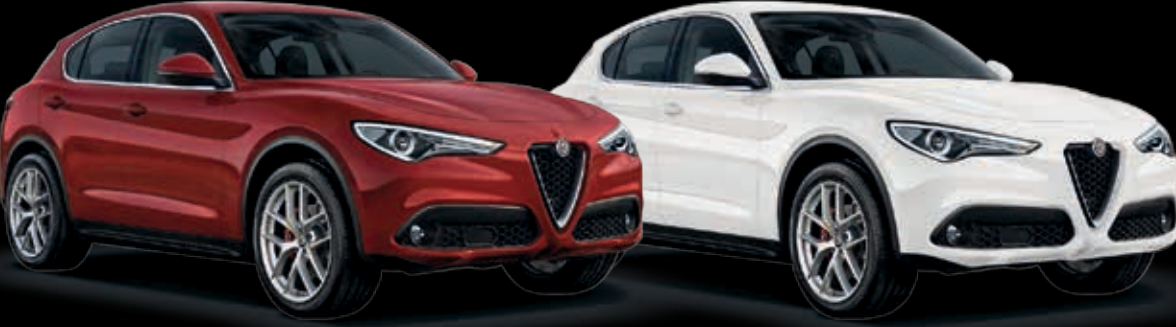
Červená Alfa Bílá Alfa