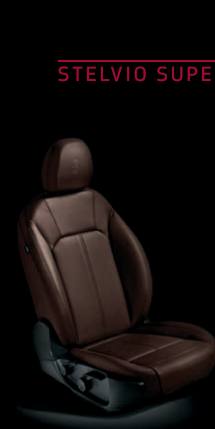
Tmavě hnědé kožené čalounění (volitelně)