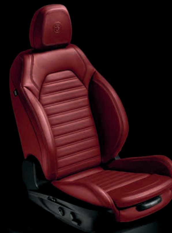
Červená kožená sportovní sedadla