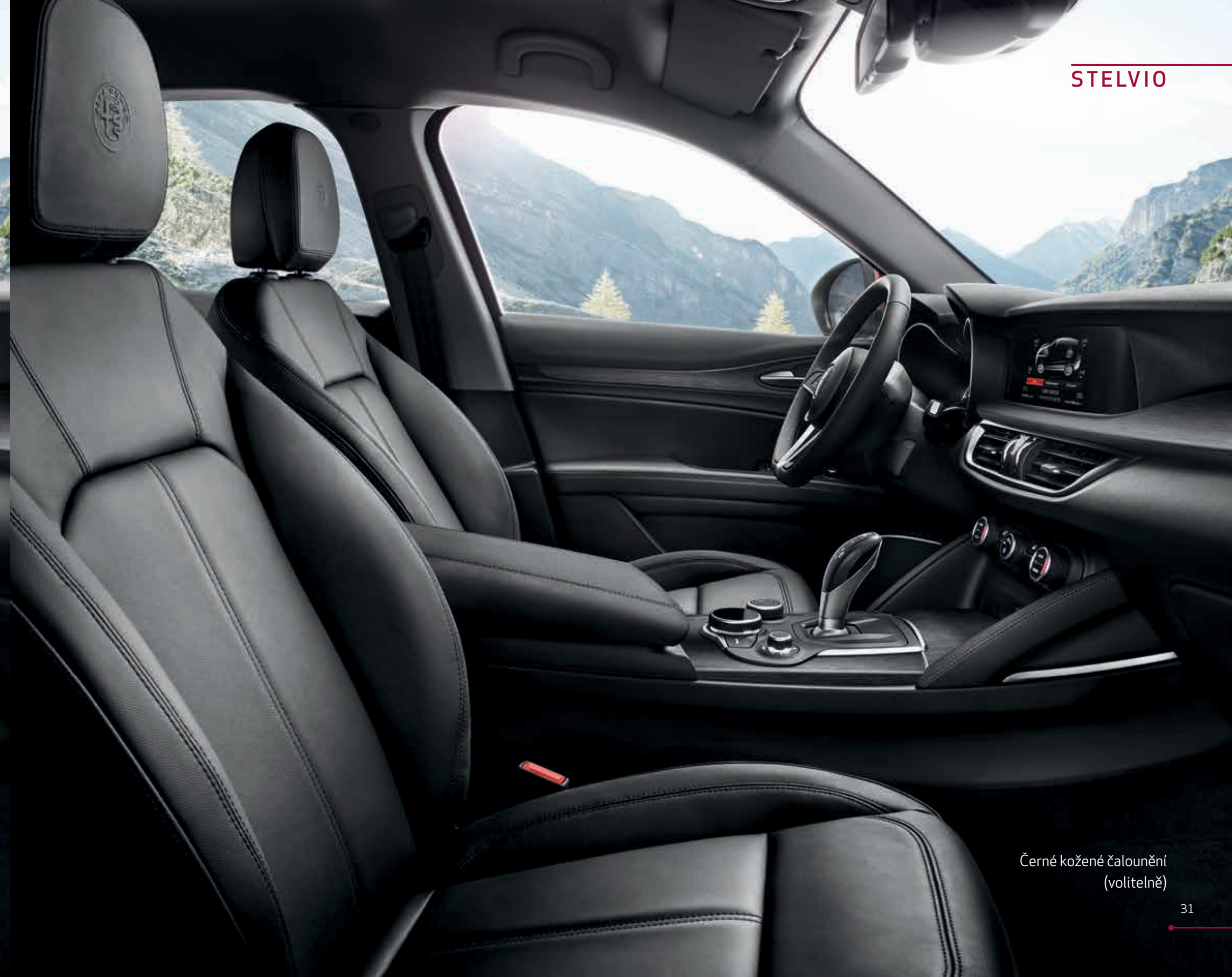
Černé kožené čalounění (volitelně)