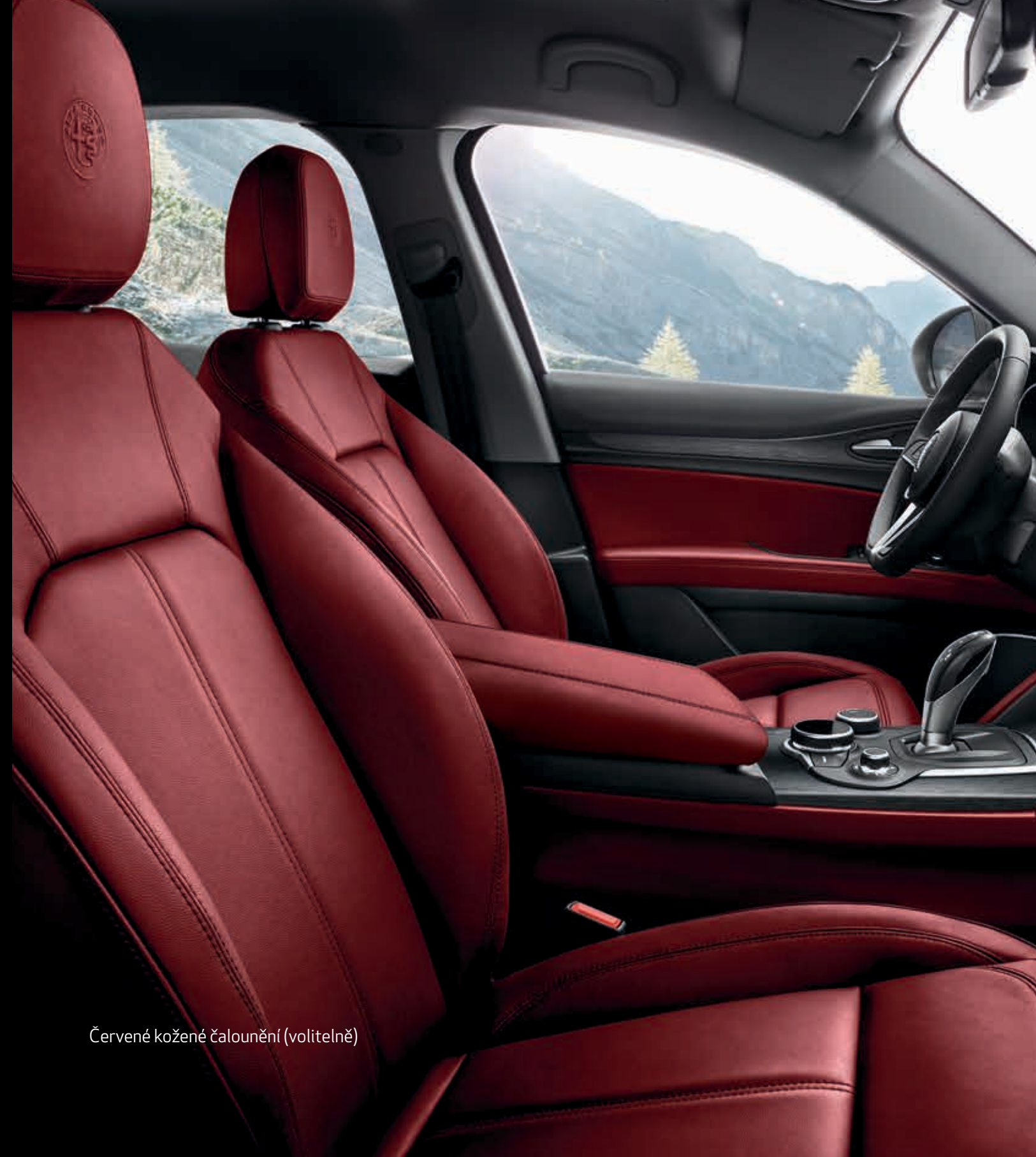
Červené kožené čalounění (volitelně)