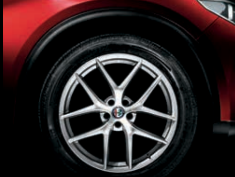
5A6 – 20" litá kola TROFEO