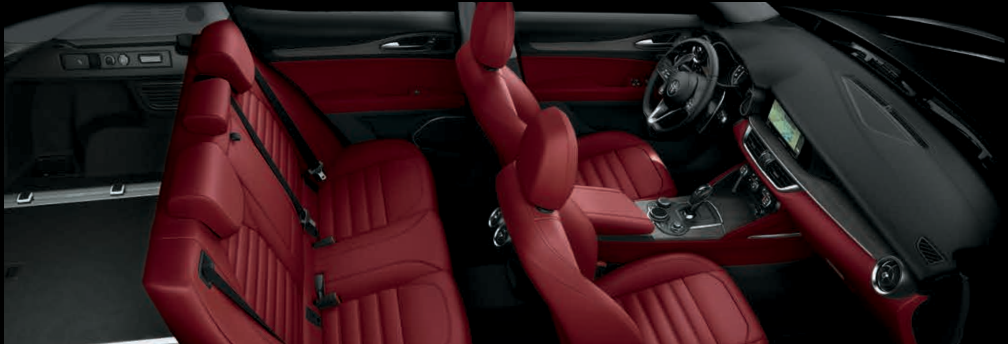
Červený kožený přístrojový panel s obložením z šedého dubu – červené kožené čalounění