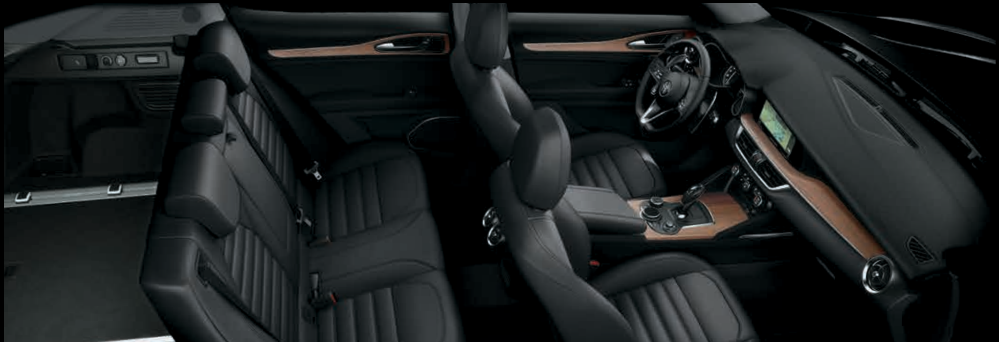
Černý přístrojový panel s obložením z ořechového dřeva – černá kůže