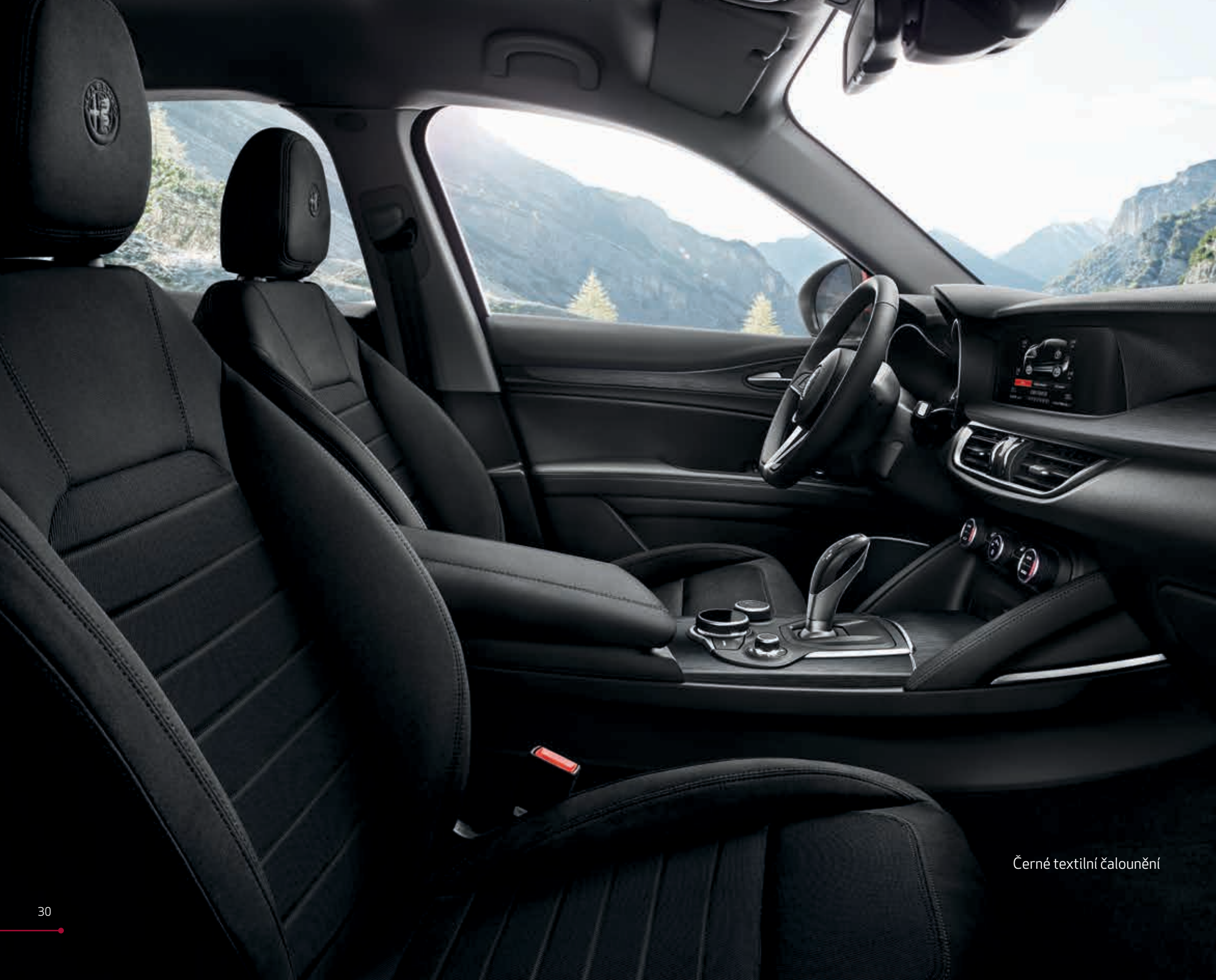
Černé textilní čalounění