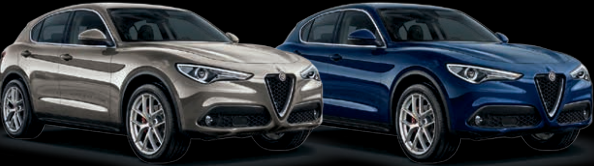
Titanová Imola Modrá Montecarlo