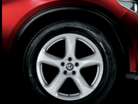
4AY – 18" litá kola SUPER