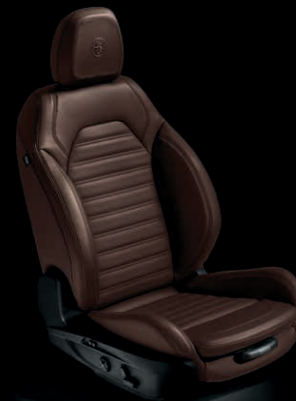
Tmavě hnědá kožená sportovní sedadla