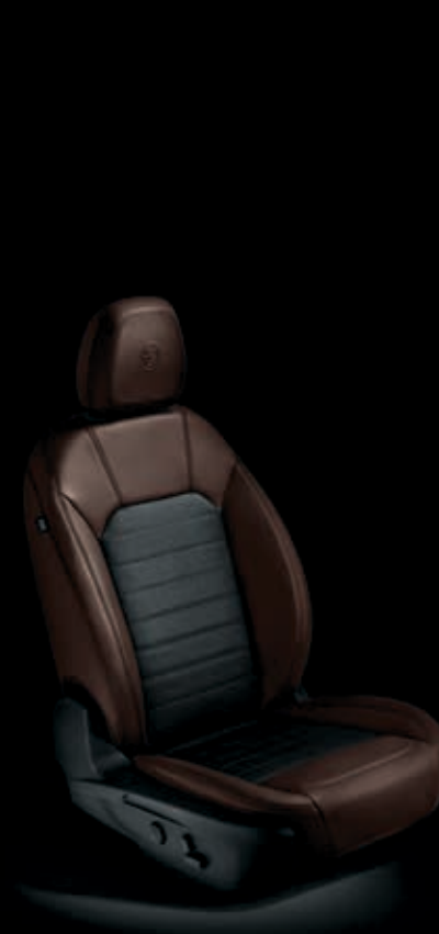
Tmavě hnědá eko kůže a textil