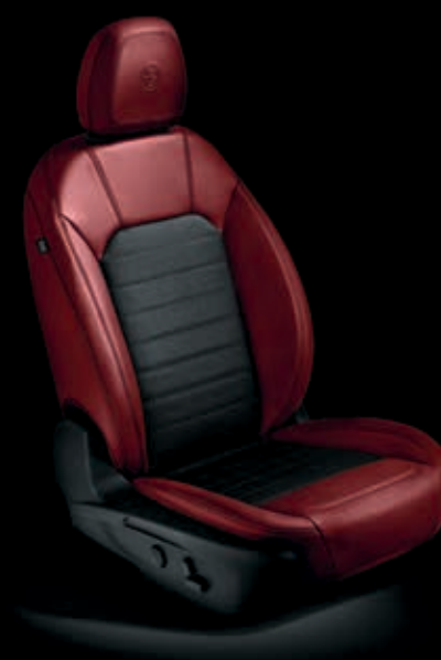
Červená eko kůže a textil