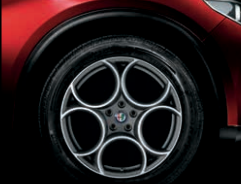
5EV – 19" litá kola CLASSICO