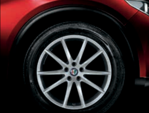
5FB – 19" litá kola SPORT