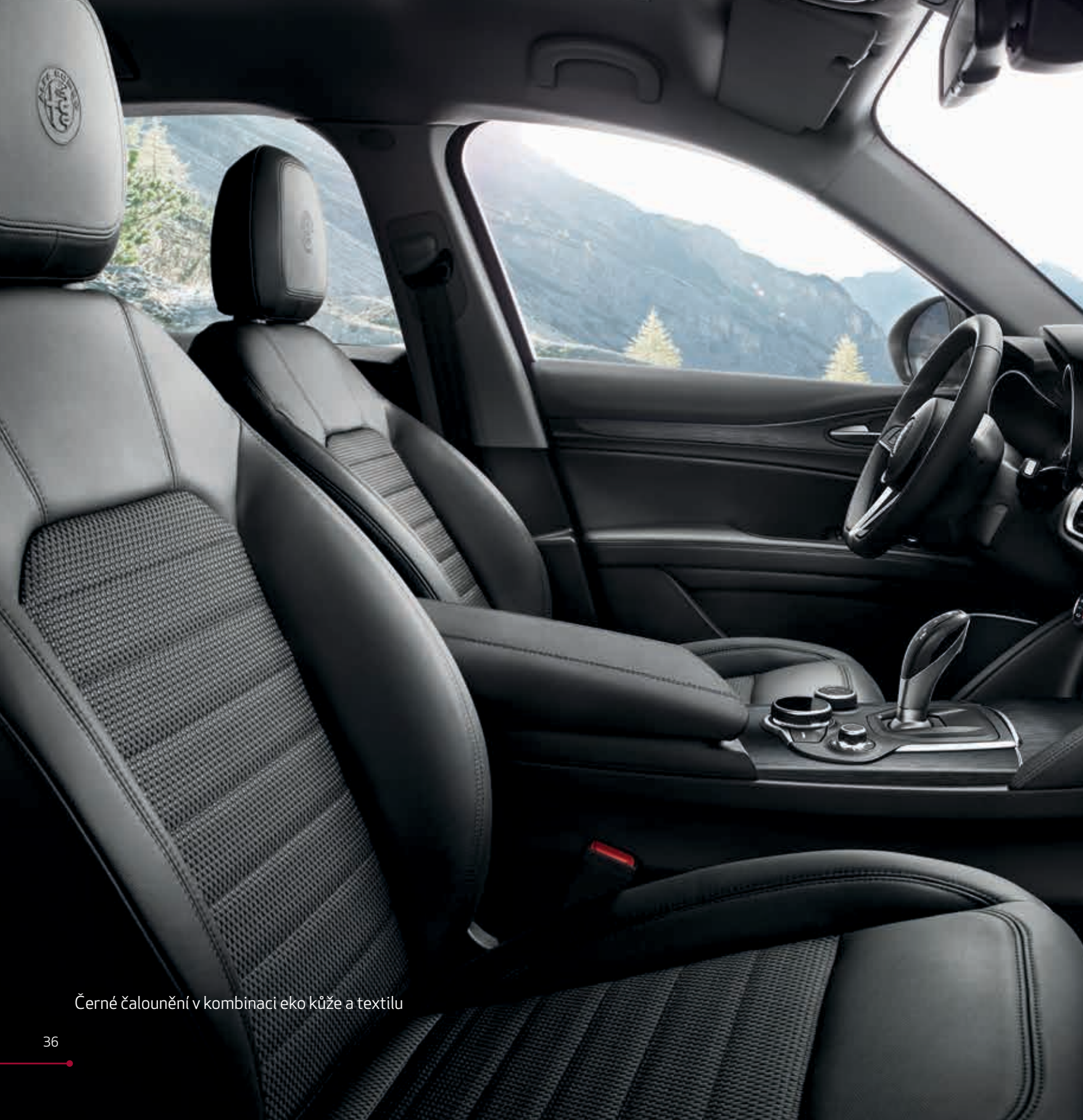
Černé čalounění v kombinaci eko kůže a textilu