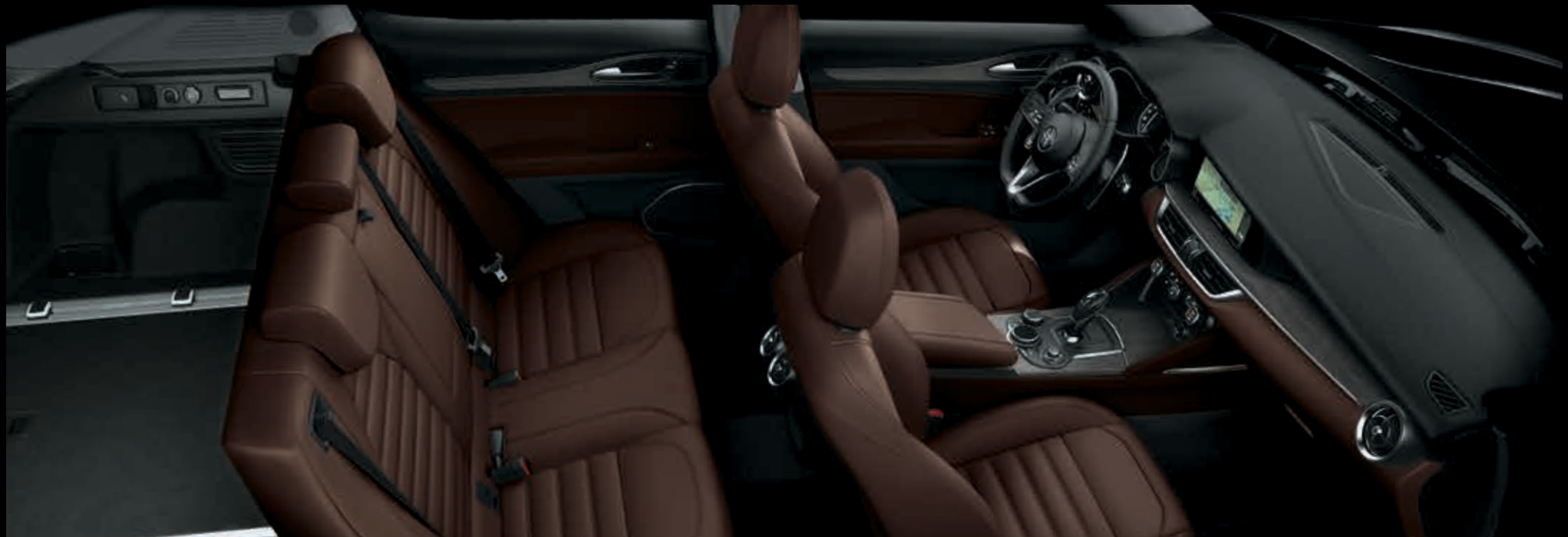
Tmavě hnědý kožený přístrojový panel s obložením z šedého dubu – tmavě hnědé kožené čalounění