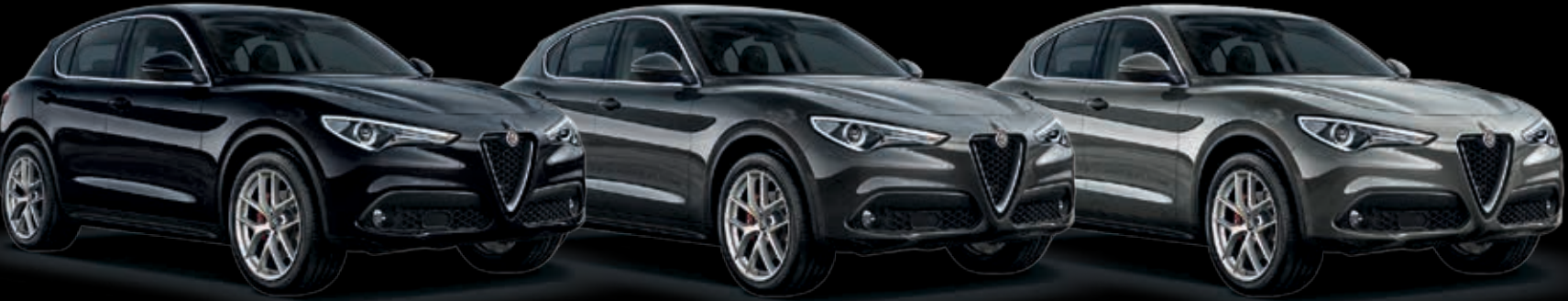
Černá Vulcano Tmavě šedá Vesuvio Šedá Stromboli