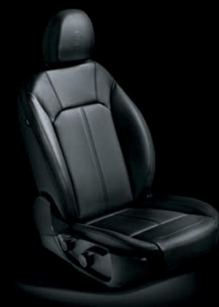
Černé kožené čalounění (volitelně)