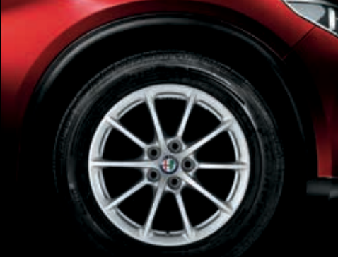
420 – 17" litá kola STELVIO