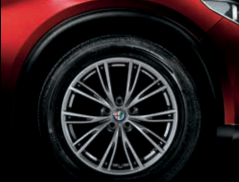
4WQ – 18" litá kola LUXURY