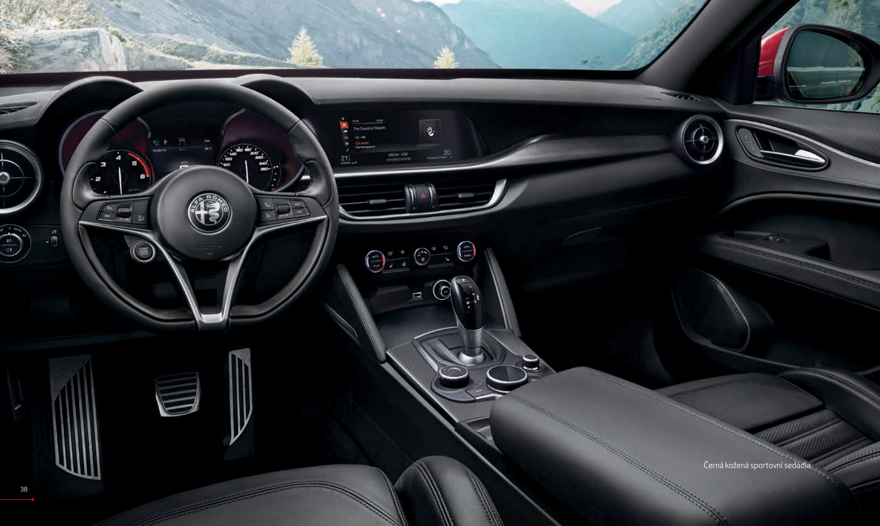
Černá kožená sportovní sedadla