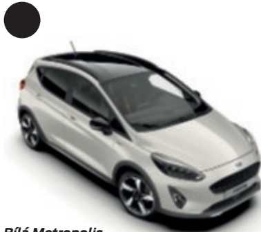
Bílá Metropolis Speciální metalický lak karoserie