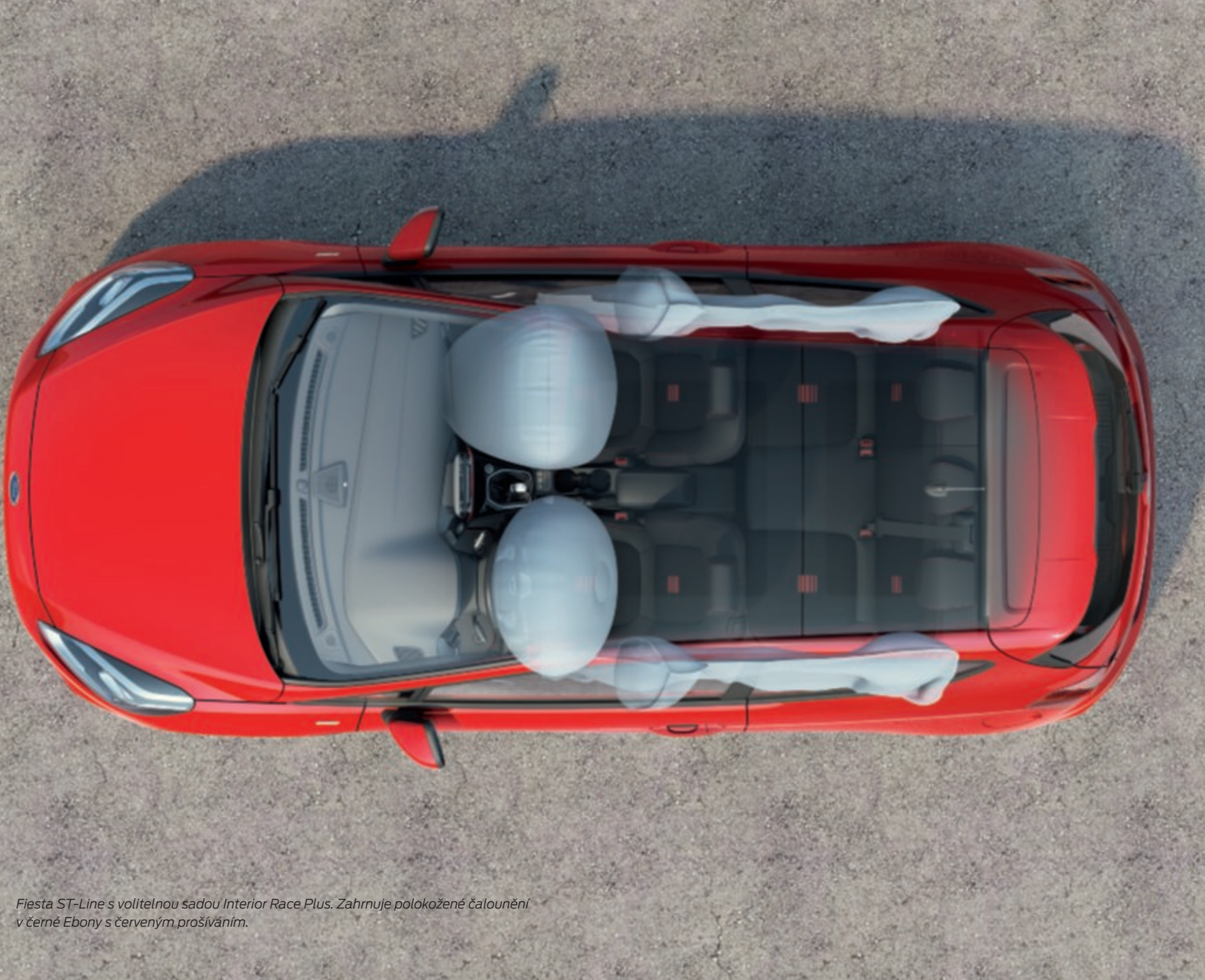
Fiesta ST-Line s volitelnou sadou Interior Race Plus. Zahrnuje polokožené čalounění v černé Ebony s červeným prošíváním.