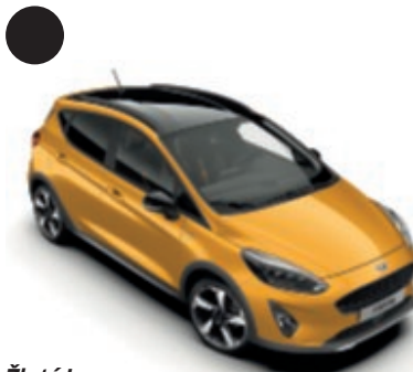
Žlutá Luxe Metalický lak karoserie