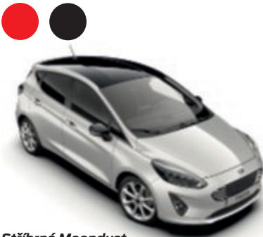
Stříbrná Moondust Metalický lak karoserie