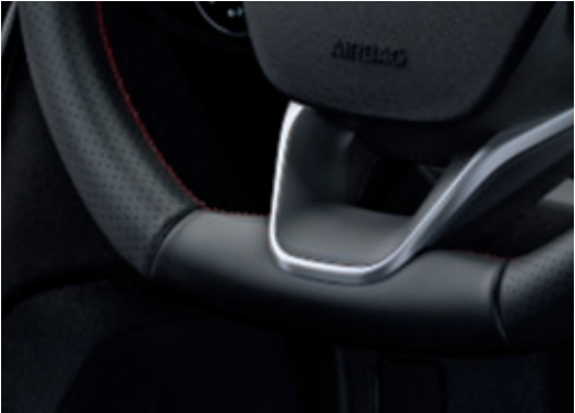
Kožený sportovní volant nastavitelný ve 4 směrech (Standardní výbava)