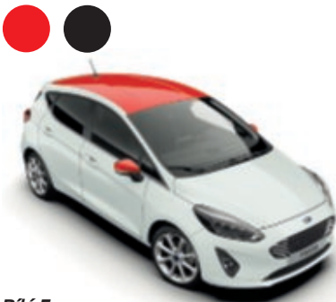
Bílá Frozen Speciální nemetalický lak karoserie