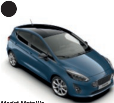
Modrá Metallic Metalický lak karoserie