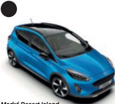
Modrá Desert Island Speciální metalický lak karoserie