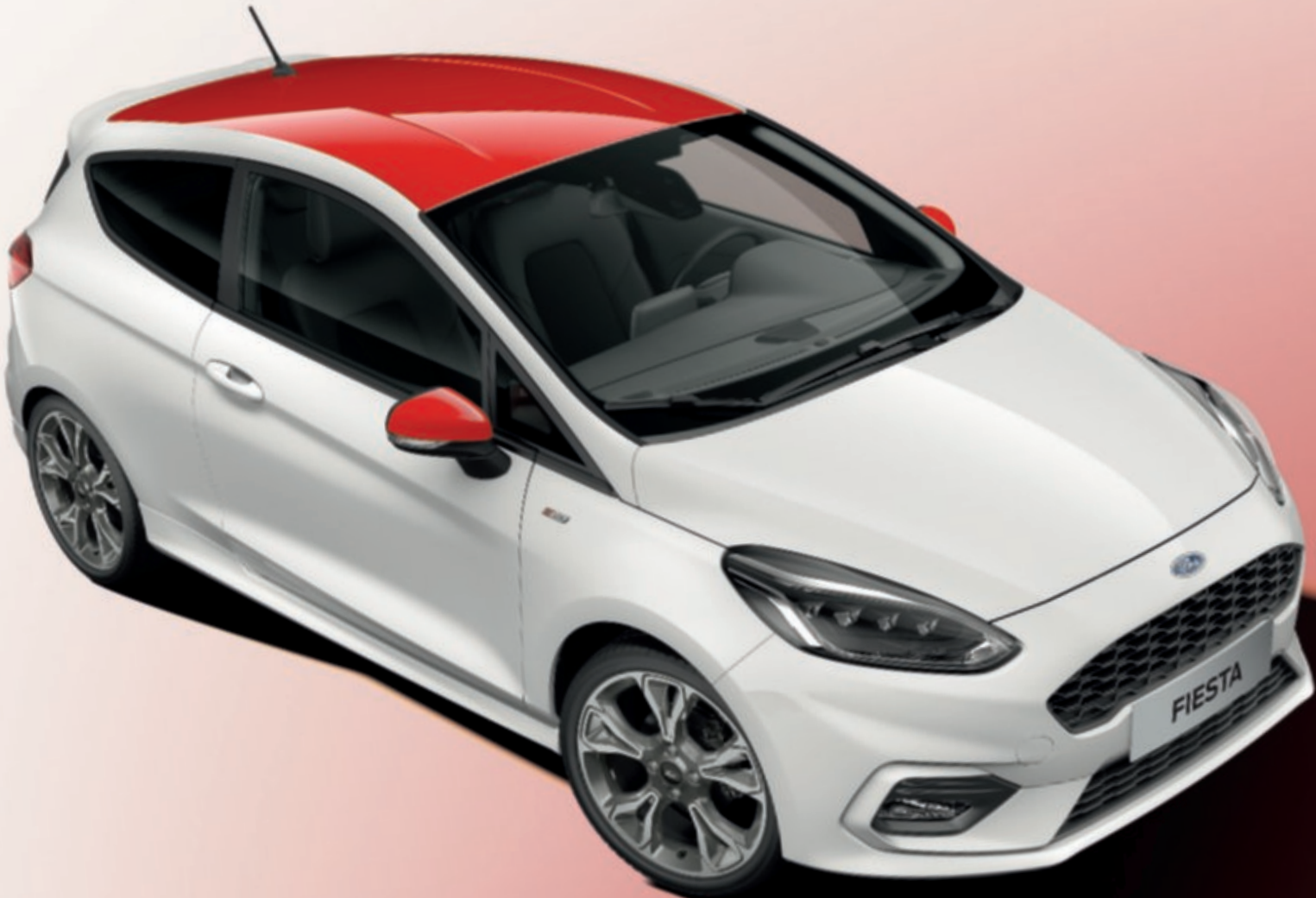
Ford Fiesta ST-Line se speciálním nemetalickým lakem karoserie bílá Frozen, střechou a vnějšími zpětnými zrcátky lakovanými v červené barvě a 18" koly z lehkých slitin s 5x2 paprsky v provedení Rock Metallic.

Poznámka: Barva přístrojové desky je ve všech provedeních v barvě černá Ebony. *Za příplatek.