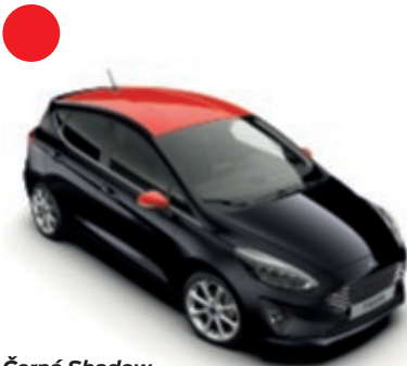
Černá Shadow Mica lak karoserie