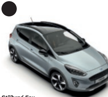
Stříbrná Fox Unikátní metalický lak karoserie