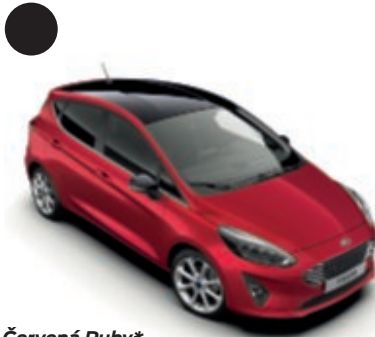
Červená Ruby* Unikátní metalický lak karoserie