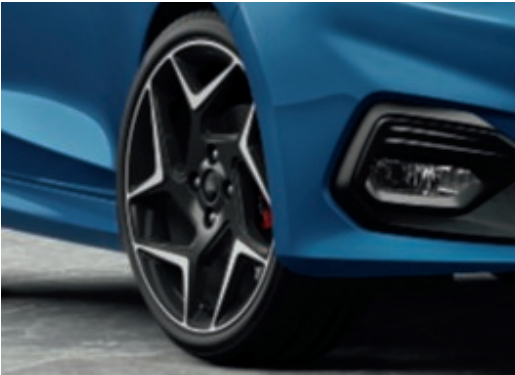
18" kola z lehkých slitin s 5x2 paprsky v tmavě šedém provedení. (Výbava na přání)

Motory Zážehové motory 1.5 EcoBoost (200 k)