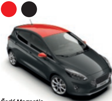
Šedá Magnetic Speciální metalický lak karoserie