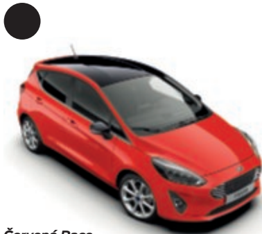
Červená Race Speciální nemetalický lak karoserie

Vytvořte si svou dokonalou Fiestu. Barevné ikony níže označují kontrastní barevné možnosti střechy a vnějších zpětných zrcátek, které jsou k dispozici pro většinu barev karoserie. (Výbava na přání u modelů ST-Line, Active a Active Plus)