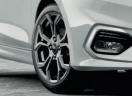
17" kola z lehkých slitin s 5x2 paprsky typu „Y“ v šedé barvě (Standardní výbava)