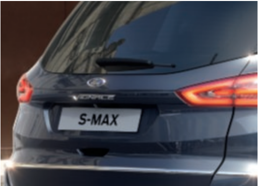
Chromované logo Vignale (Standardní výbava)