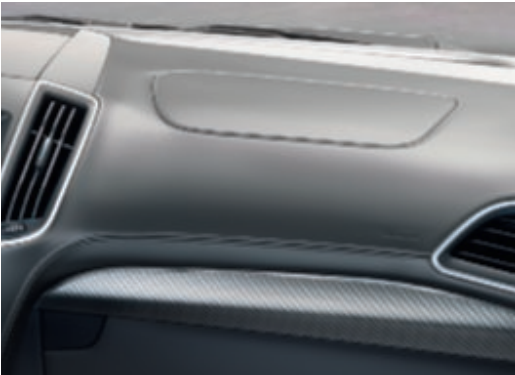
Kožená přístrojová deska (Standardní výbava)