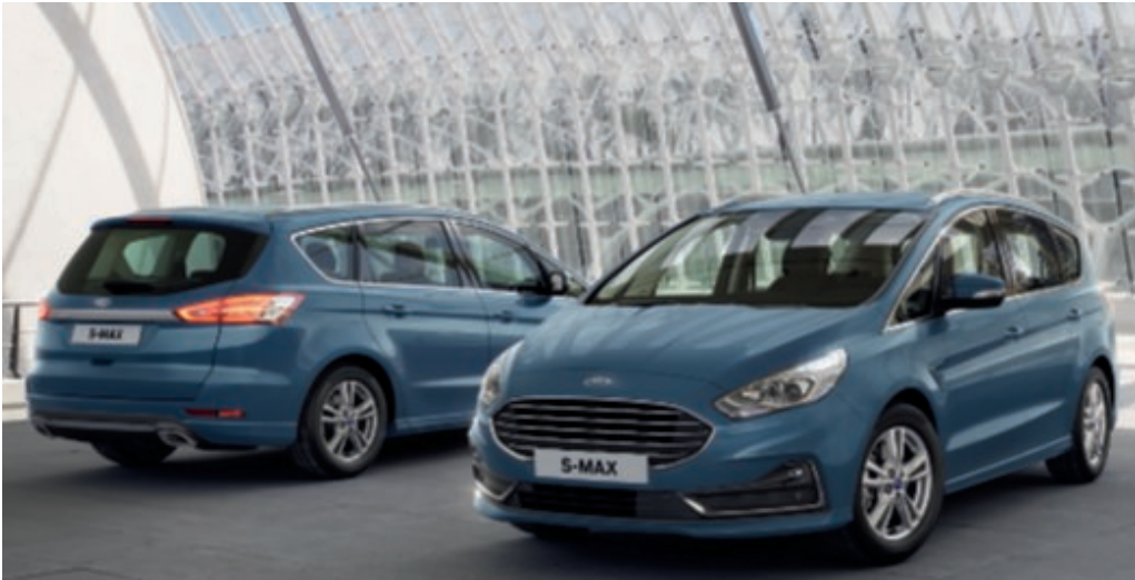
S-MAX Titanium v barvě laku modrá Metallic (za příplatek).