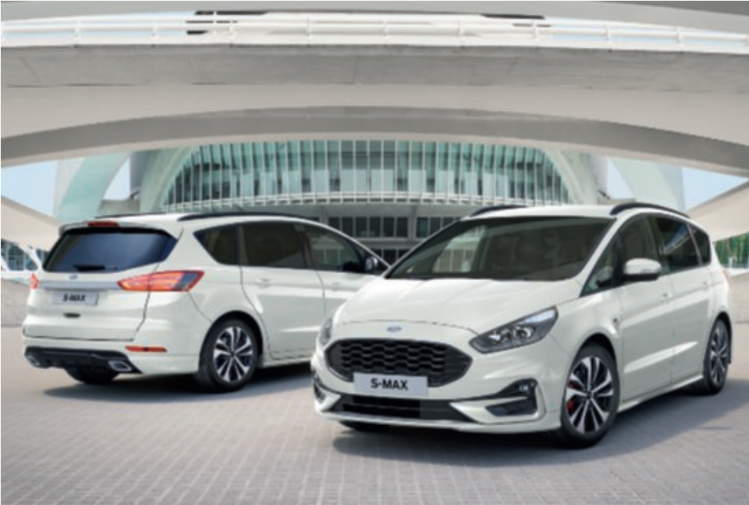
S-MAX ST-Line v barvě laku bílá Frozen (za příplatek).