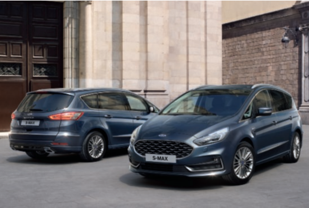
S-MAX Vignale v barvě laku modrá Panther (za příplatek).

Motory: Vznětové motory: 2.0 EcoBlue 190 k (140 kW) automatická AWD 2.0 EcoBlue Bi-Turbo 240 k (177 kW) automatická