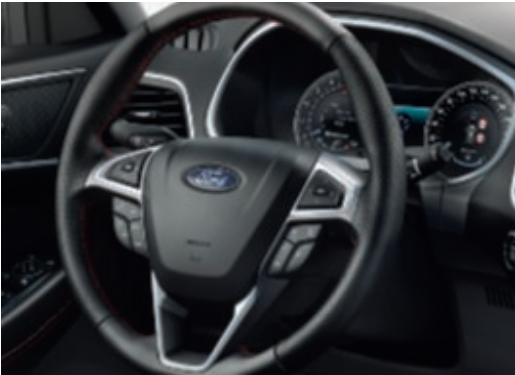
Kožený volant s červeným prošíváním (Standardní výbava)