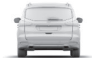
Šířka bez zrcátek: 1916 mm