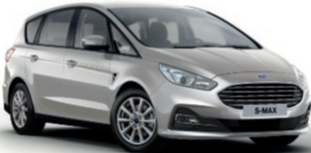
Trend (Není dostupný v ČR)

Nové vozy Ford S-MAX jsou k dispozici v jedinečných individuálních řadách. Ať již preferujete komfort luxusního vozu, nebo jste milovníky dynamiky sportovního provedení, nový S-MAX je tu pro vás. Aby bylo vaše rozhodování ještě snazší, najdete bohatou standardní výbavu již od základní verze Titanium. Takže nyní, ať už se rozhodnete pro kterýkoliv výbavový stupeň Fordu S-MAX, můžete si užít nejenom vysokou úroveň standardní výbavy, ale také celou řadu doplňkových prvků, které jsou k dispozici samostatně nebo jako součást volitelných sad.