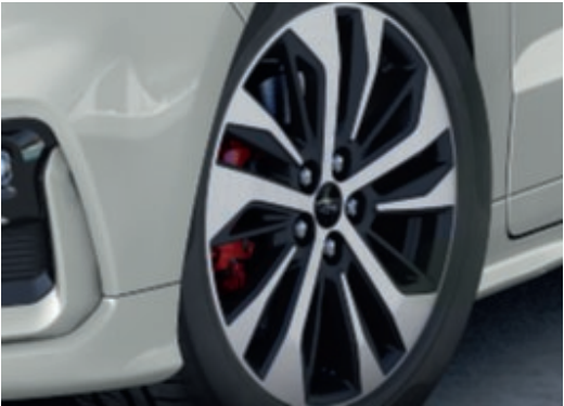
Červeně lakované brzdové třmeny (Standardní výbava)