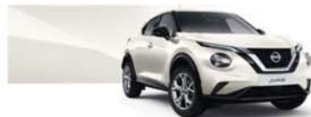
bílá Pearl (P) – QAB