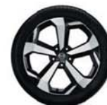
19" hliníková kola