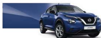
modrá Indigo (M) – RBN