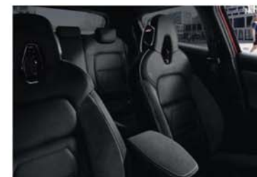
BALÍČEK N-DESIGN ČERNÝ – CHIC černé částečně kožené čalounění s černými segmenty