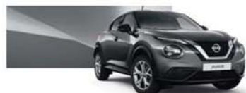
šedá Gun (M) – KAD