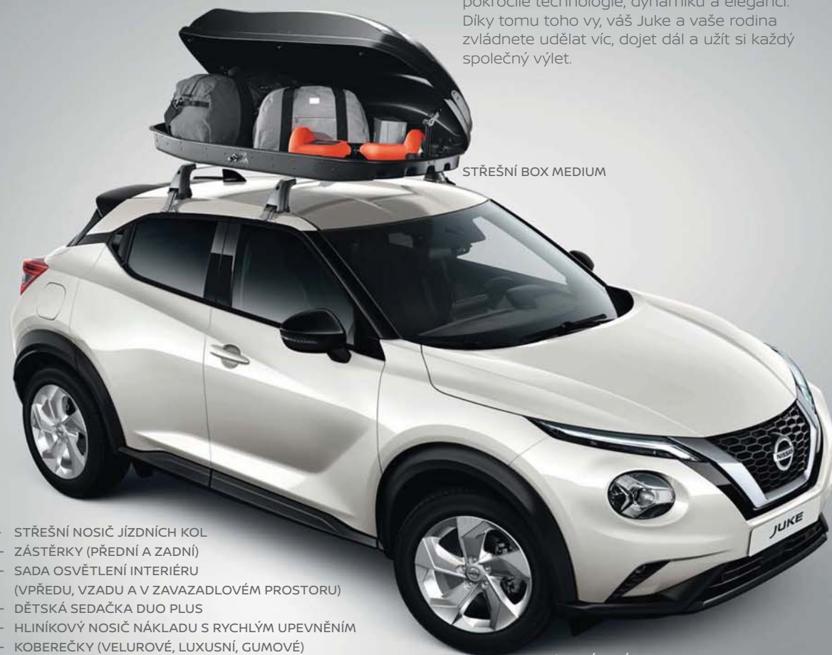
STŘEŠNÍ BOX MEDIUM

Stejně jako váš JUKE je i jeho příslušenství navrženo tak, aby do každého dne přinášelo pokročilé technologie, dynamiku a eleganci. Díky tomu toho vy, váš Juke a vaše rodina zvládnete udělat víc, dojet dál a užít si každý společný výlet.