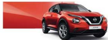
červená Fuji Sunset (M) – NBV