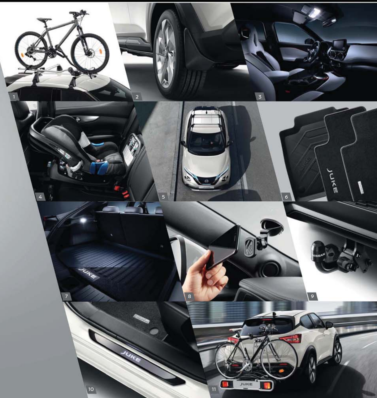
17" HLINÍKOVÁ KOLA SE STŘEDOVOU KRYTKOU