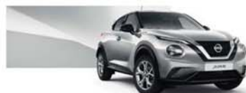
stříbrná Blade (M) – KYO