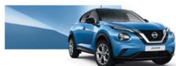
modrá Vivid (M) – RCA