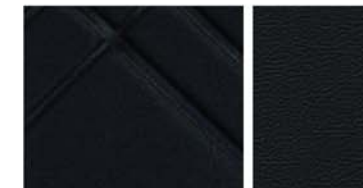
TEKNA, STANDARDNÍ VÝBAVA černé reliéfní čalounění se syntetickou kůží / černé čalounění