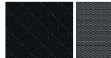
N-CONNECTA, STANDARDNÍ VÝBAVA Černé reliéfní textilní / šedé textilní čalounění