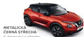
METALICKÁ ČERNÁ STŘECHA K dispozici s těmito barvami karoserie: