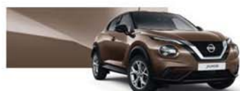
bronzová Chestnut (M) – CAN