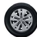
Ozdobné kryty 16" kol