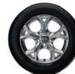
17" hliníková kola