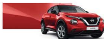
pastelová červená (S) – Z10