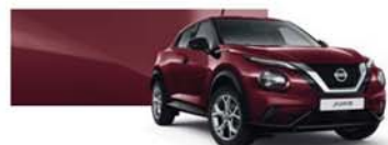
vínová Burgundy (M) – NBQ