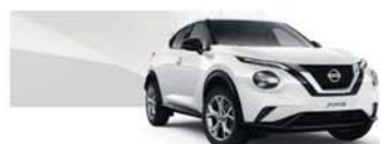
pastelová bílá (S) – 326