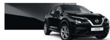
metalická černá (M) – Z11