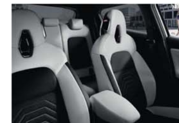
BALÍČEK N-DESIGN BÍLÝ – LIFESTYLE černé reliéfní čalounění s bílými PVC segmenty