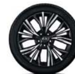
19" hliníková kola Aakari