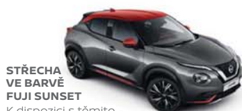
STŘECHA VE BARVĚ FUJI SUNSET K dispozici s těmito barvami karoserie: