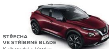
STŘECHA VE STŘÍBRNÉ BLADE K dispozici s těmito barvami karoserie: