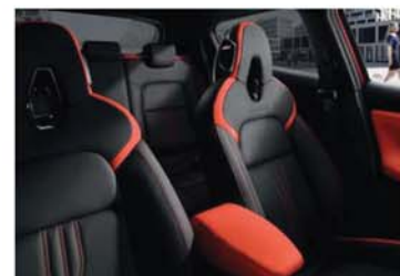
BALÍČEK N-DESIGN ORANŽOVÝ – ACTIVE černé částečně kožené čalounění s oranžovými segmenty