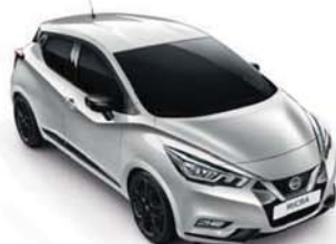
BARVA KAROSERIE: STŘÍBRNÁ PLATINUM - ZBD SADA EXTERIÉR PLUS: ČERNÁ ENIGMA INTERIÉR: ŠEDÁ STANDARD