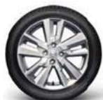
16" hliníková kola