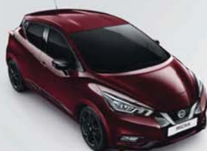
BARVA KAROSERIE: VÍNOVÁ BURGUNDY - NBT SADA EXTERIÉR PLUS: ČERNÁ ENIGMA INTERIÉR: ŠEDÁ STANDARD