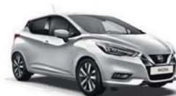
Stříbrná Platinum – M – ZBD