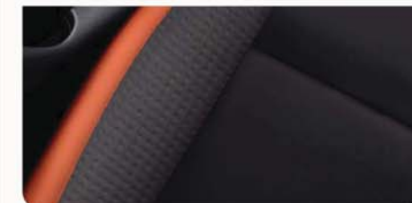
ORANŽOVÁ ENERGY Volitelné pro stupně výbavy ACENTA až TEKNA