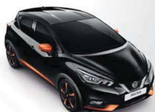
BARVA KAROSERIE: ČERNÁ ENIGMA - GNE SADA EXTERIÉR PLUS: ORANŽOVÁ ENERGY INTERIÉR: ORANŽOVÁ ENERGY

Hrajte si s našimi balíčky pro přizpůsobení. Po vaší návštěvě v Design Studiu Nissan už na světě nebude stejná Micra jako ta vaše.