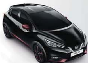
BARVA KAROSERIE: ČERNÁ ENIGMA - GNE SADA EXTERIÉR PLUS: VÍNOVÁ BURGUNDY INTERIÉR: ČERVENÁ INVIGORATING