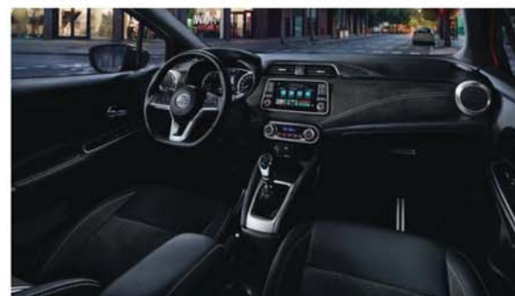
Alcantara® s prvky z umělé kůže Standard u N-SPORT, volitelné pro N-CONNECTA a TEKNA