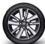
16" hliníková kola, řezaná diamantem