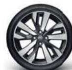
17" hliníková kola, řezaná diamantem