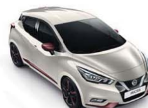
BARVA KAROSERIE: STŘÍBRNÁ WARM - KKV SADA EXTERIÉR PLUS: VÍNOVÁ BURGUNDY INTERIÉR: ŠEDÁ STANDARD