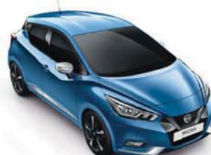
BARVA KAROSERIE: MODRÁ POWER - RQG SADA EXTERIÉR PLUS: CHROMOVÁ VIBRANT INTERIÉR: ŠEDÁ STANDARD