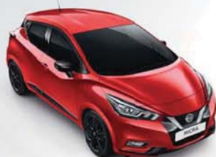
BARVA KAROSERIE: ČERVENÁ PASSION - NBD SADA EXTERIÉR PLUS: ČERNÁ ENIGMA INTERIÉR: ČERVENÁ INVIGORATING