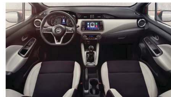
Textilní Absolute, černé / šedé Standard u TEKNA