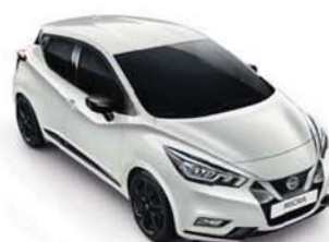
BARVA KAROSERIE: BÍLÁ GLAZE - QNC SADA EXTERIÉR PLUS: ČERNÁ ENIGMA INTERIÉR: ŠEDÁ STANDARD

SADA EXTERIÉR PLUS: Pro ještě bohatší zážitek přidejte k balíčku Exteriér ještě 17" hliníková kola s barevnými segmenty.