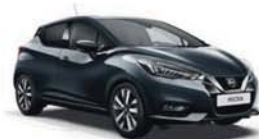
Šedá Gunmetal – M – KPN