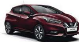
Vínová Burgundy – M – NBT