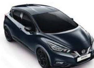
BARVA KAROSERIE: ŠEDÁ GUNMETAL - KPN SADA EXTERIÉR PLUS: ČERNÁ ENIGMA INTERIÉR: ŠEDÁ STANDARD