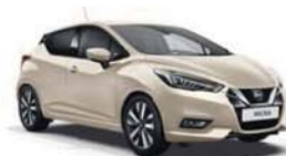
Bílá Ivory – S – D16