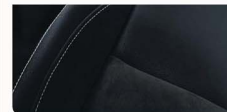
ALCANTARA* S PRVKY Z UMĚLÉ KŮŽE Standard u N-SPORT. Volitelné pro N-CONNECTA a TEKNA