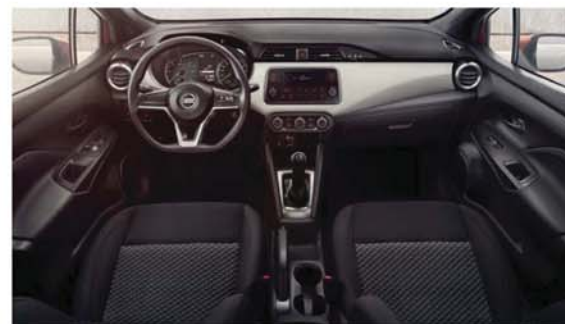
Textilní Casual, černé standard u VISIA