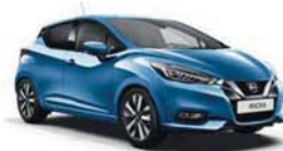
Modrá Power – M – RQG