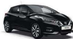
Černá Enigma – M – GNE