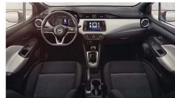
Textilní Casual, černé Standard u ACENTA