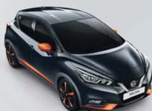
BARVA KAROSERIE: ŠEDÁ GUNMETAL - KPN SADA EXTERIÉR PLUS: ORANŽOVÁ ENERGY INTERIÉR: ORANŽOVÁ ENERGY