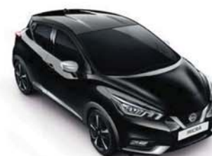
BARVA KAROSERIE: ČERNÁ ENIGMA - GNE SADA EXTERIÉR PLUS: CHROMOVÁ VIBRANT INTERIÉR: ŠEDÁ STANDARD