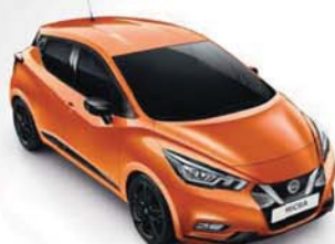
BARVA KAROSERIE: ORANŽOVÁ ENERGY - EBF SADA EXTERIÉR PLUS: ČERNÁ ENIGMA INTERIÉR: ORANŽOVÁ ENERGY