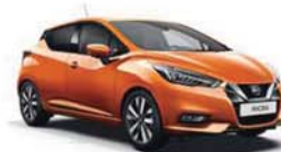
Oranžová Energy – M – EBF