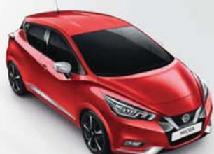
BARVA KAROSERIE: ČERVENÁ PASSION - NBD SADA EXTERIÉR PLUS: CHROMOVÁ VIBRANT INTERIÉR: ŠEDÁ STANDARD