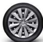
16" ocelová kola