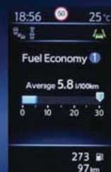
INFORMACE O JÍZDĚ V REÁLNÉM ČASE