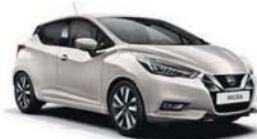
Stříbrná Warm – M – KNV