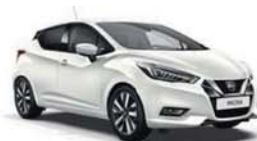
Bílá Glaze – P – QNC