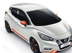
BARVA KAROSERIE: BÍLÁ GLAZE - QNC SADA EXTERIÉR PLUS: ORANŽOVÁ ENERGY INTERIÉR: ALCANTARA* S PRVKY Z UMĚLÉ KŮŽE