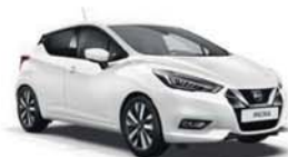
Pastelová bílá – S – ZV2