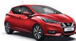
Červená Passion – P – NDB