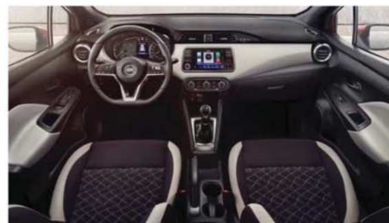
Textilní Modern, černé / šedé Standard u N-CONNECTA