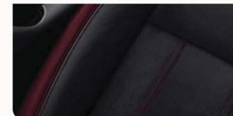
ČERVENÁ INVIGORATING Volitelné pro stupně výbavy N-CONNECTA a TEKNA