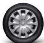
15" ocelová kola