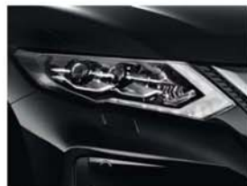
Černá - P - G41