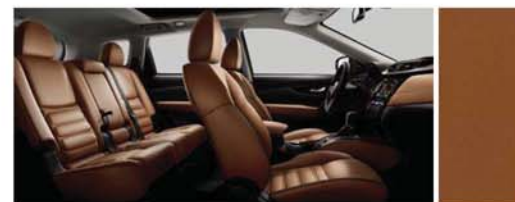
TMAVĚ HNĚDÁ TAN KŮŽE SE SPECIÁLNÍM PROŠÍVÁNÍM