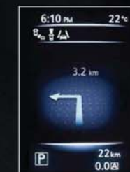
NAVIGACE KROK ZA KROKEM