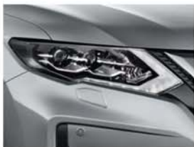
Stříbrná Blade - M - K23