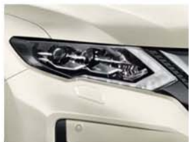
Bílá Pearl - 3P - QAB