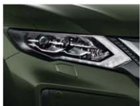
Olivová Titanium - PM - EAN