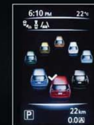
VÝBĚR BARVY VOZU NA DISPLEJI