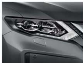
Šedá Gun - M - KAD