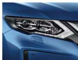
Modrá Vivid - PM - RAW