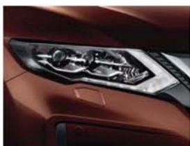
Bronzová Chestnut - P - CAS