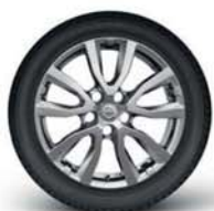
17" hliníková kola (stříbrně lakovaná)