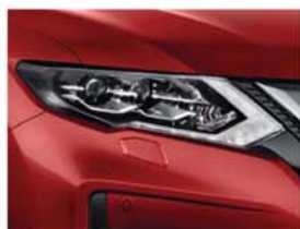
Červená - S - AX6