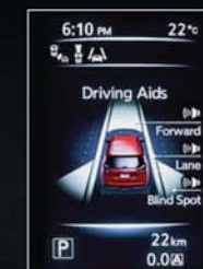
ASISTENČNÍ SYSTÉMY ŘIDIČE