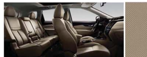
PERFOROVANÁ KŮŽE - BÉŽOVÁ