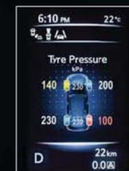
SYSTÉM MONITOROVÁNÍ TLAKU V PNEUMATIKÁCH