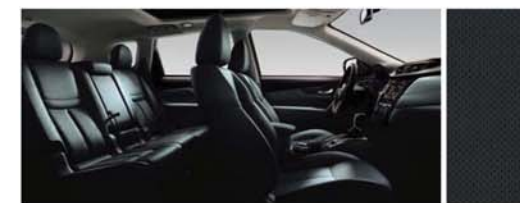
PERFOROVANÁ KŮŽE - ČERNÁ