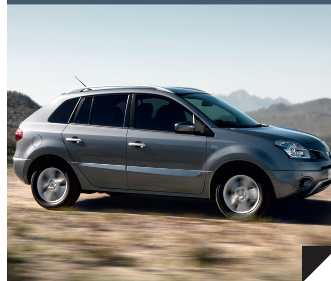
VYTIŠTĚNO V EU – DUBEN 2008

Bylo vynaloženo veškeré úsilí, aby obsah této publikace byl přesný a aktuální v době tisku. V rámci politiky trvalého zdokonalování produktů si společnost Renault vyhrazuje právo provést kdykoliv úpravy popisovaných a prezentovaných technických údajů, vozidel a příslušenství. Obchodní zastoupení Renault jsou informována o těchto úpravách co nejdříve. V závislosti na zemi se mohou verze pro trh lišit a některá vybavení nemusí být k dispozici (standardní nebo volitelná vybavení nebo příslušenství). Nejaktuálnější informace vám poskytne místní dealer. Z důvodu technických omezení tisku se mohou barvy prezentované v tomto dokumentu mírně lišit od skutečných barev laku a nebo obložení interiéru. Všechna práva vyhrazena. Kopírování celého předmetného dokumentu nebo jeho částí v jakékoliv formě a jakýmkoliv způsobem je zakázáno bez předchozího schválení společností Renault.