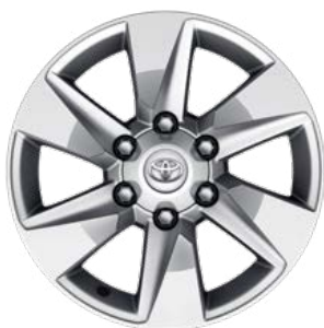
17" disky kol z lehké slitiny Standard pro výbavu Legend