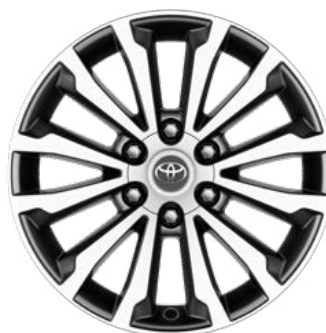
19" disky kol z lehké slitiny Standard pro výbavu Active, Trend a Executive