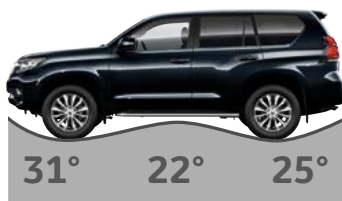
Přední nájezdový úhel, Přechodový úhel, Zadní nájezdový úhel