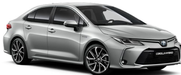
1F7 Stříbrná – saténová metalický lak