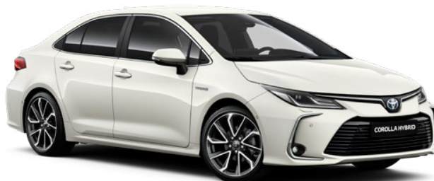
070 Bílá – perleťová perleťový lak