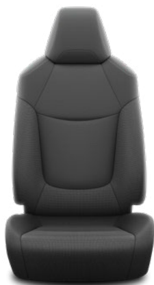
Černá textilie Standardně pro Active konvenční