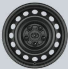
15" ocelové disky kol Na přání