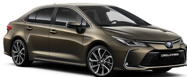
6X1 Bronzovozelená metalický lak

Barva karosérie může záviset na verzi výbavy.