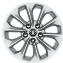
16" kola z lehkých slitin (10 paprsků)