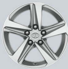
16" kola z lehkých slitin, stříbrná (5 paprsků) Na přání