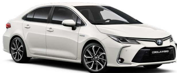
040 Bílá – čistá standardní lak