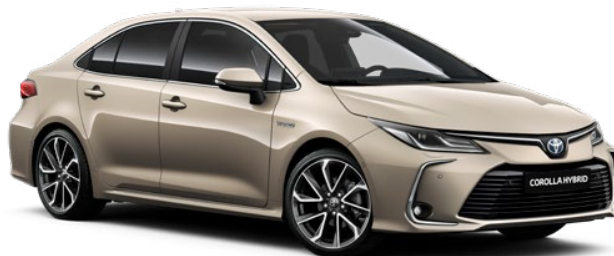
587 Běžová – Champagne metalický lak