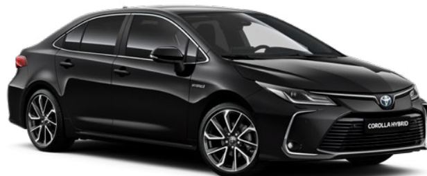
209 Černá – noční obloha metalický lak