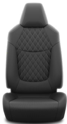
Černá textilie s prošíváními panely Active Hybrid, Active Business a Comfort