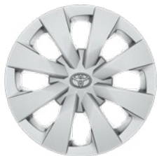
15" ocelové disky kol s ozdobnými kryty (8 paprsků)