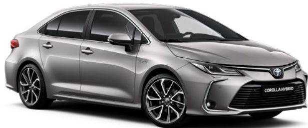
1K0 Stříbrná – kovová speciální lak