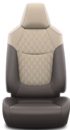
Běžovo-hnědé polokožené čalounění s prošíváními panely Standardně pro Executive