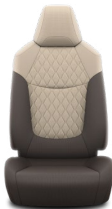
Běžovo-hnědá textilie s prošíváními panely Standardně pro Active Hybrid, Active Business a Comfort