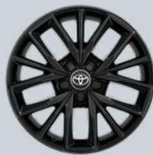
17" kola z lehkých slitin, černá (5 trojitých paprsků) Na přání