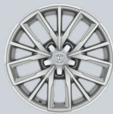
17" kola z lehkých slitin, stříbrná (5 trojitých paprsků) Na přání