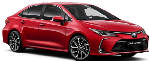
3U5 Červená – karminová speciální lak