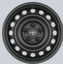
16" ocelové disky kol Na přání