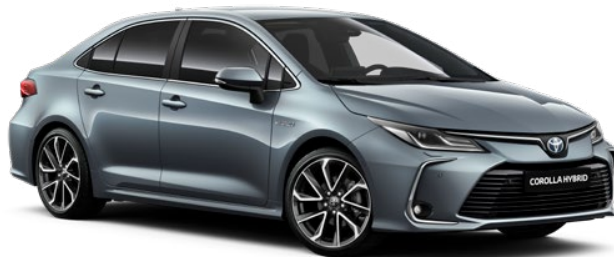
1K3 Modrošedá speciální lak