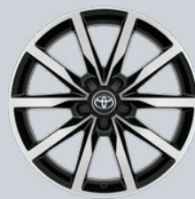
18" kola z lehkých slitin, černé broušené povrchy (5 dvojitých paprsků) Na přání