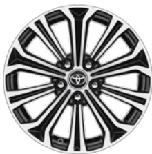
17" kola z lehkých slitin, dvoubarevné provedení, černá a broušené povrchy (10 paprsků)

Standardně pro Comfort s paketem Style a Executive