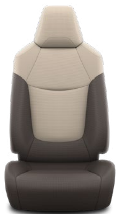
Běžovo-hnědá textilie Standardně pro Active konvenční