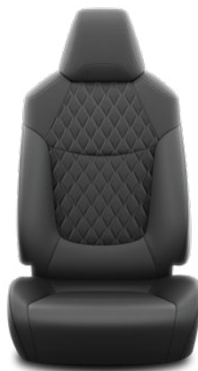
Černé polokožené čalounění s prošíváním Standardně pro Executive