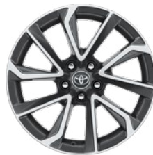
18" kola z lehkých slitin, dvoubarevné provedení, šedá a broušené povrchy (5 zdvojených paprsků)

Standardně pro Comfort s paketem Style a Executive