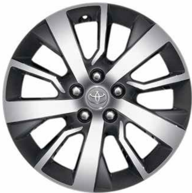
17" litá kola, pět dvojitých paprsků, tmavě šedá, strojově opracovaná

Potěší srdce i mysl. Příslušenství Toyota, jako je boční ochranný rám a kola z lehkých slitin, dodává vozu styl, který zanechá nezapomenutelný dojem, ať přijedete kamkoliv. Praktické detaily jako parkovací senzory, ochranná lišta zadního nárazníku a podlahové rohože pomáhají zachovat tento hezký vzhled delší dobu.