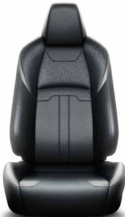
Černá kůže s šedými detaily