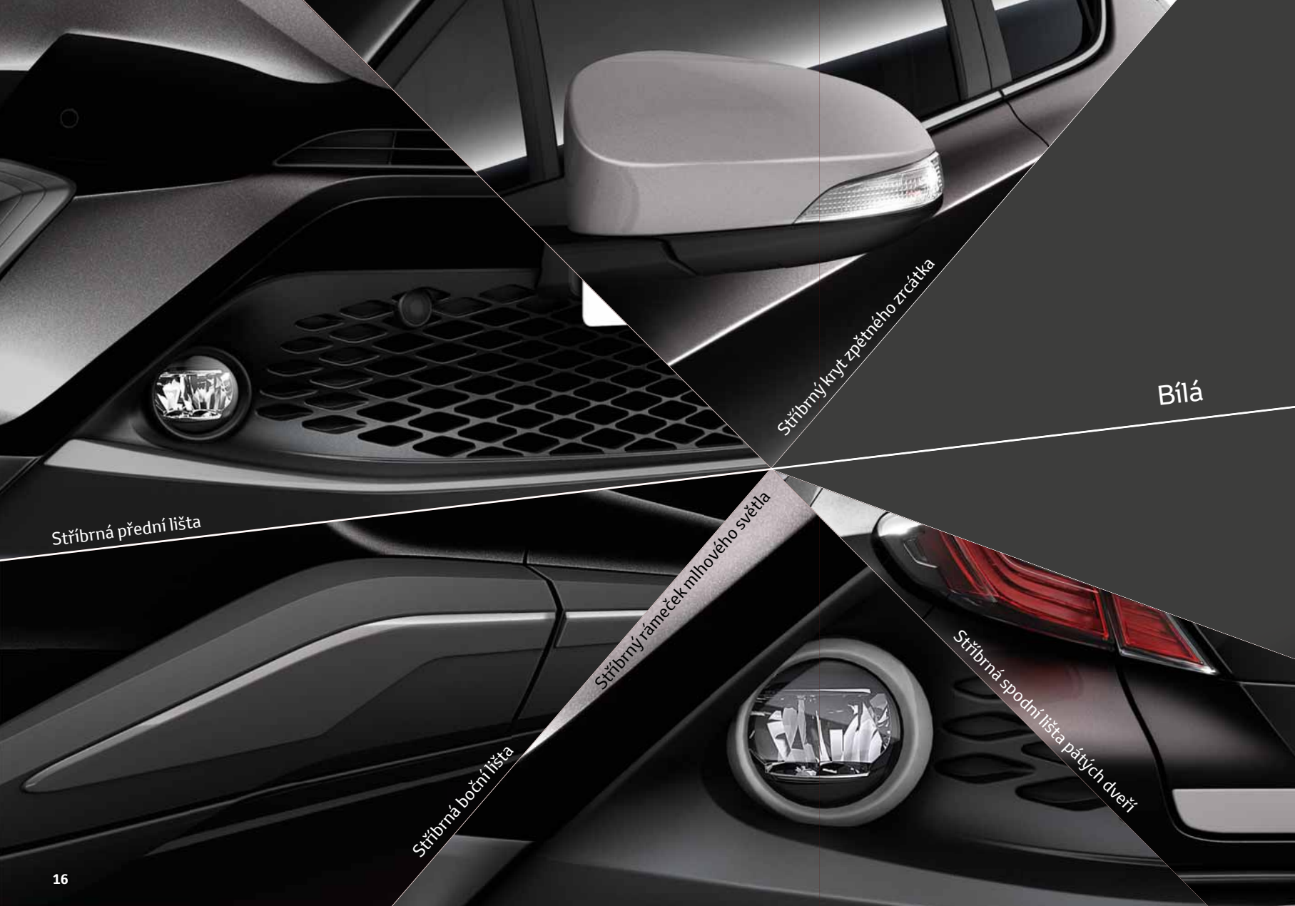
Stříbrná přední lišta