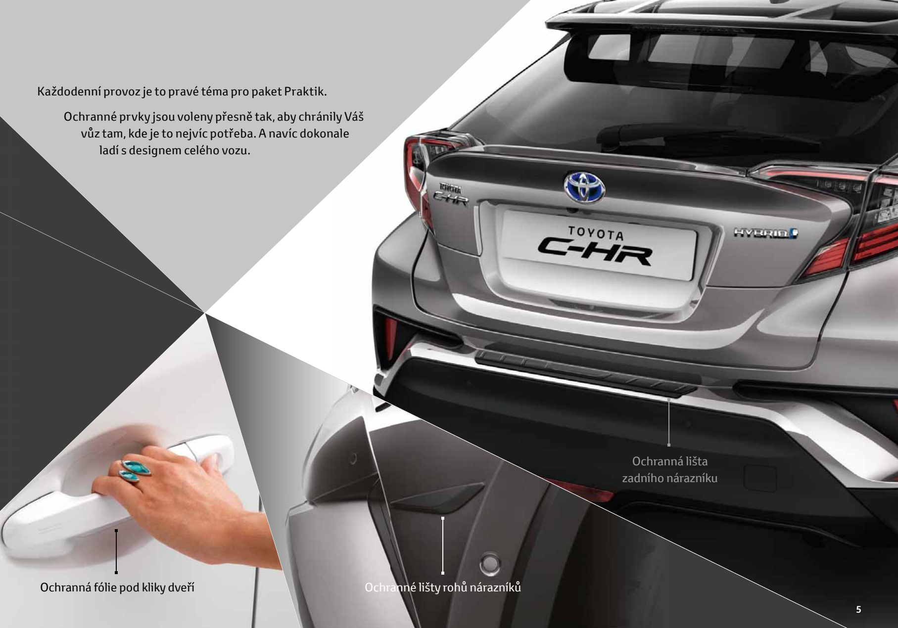
Ochranná lišta zadního nárazníku

Ochranné prvky jsou voleny přesně tak, aby chránily Váš vůz tam, kde je to nejvíc potřeba. A navíc dokonale ladí s designem celého vozu.