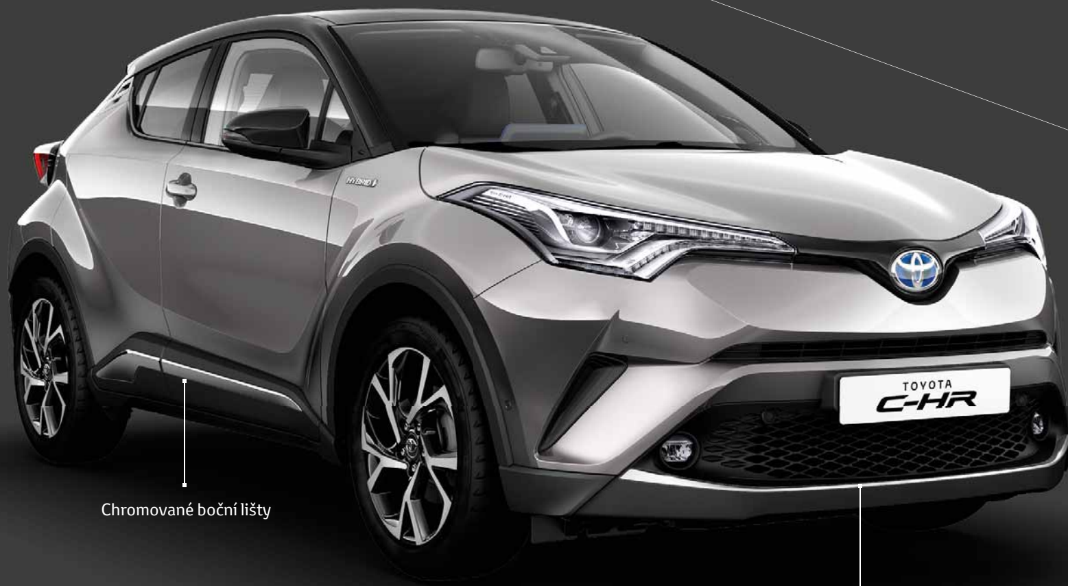
Chromované boční lišty