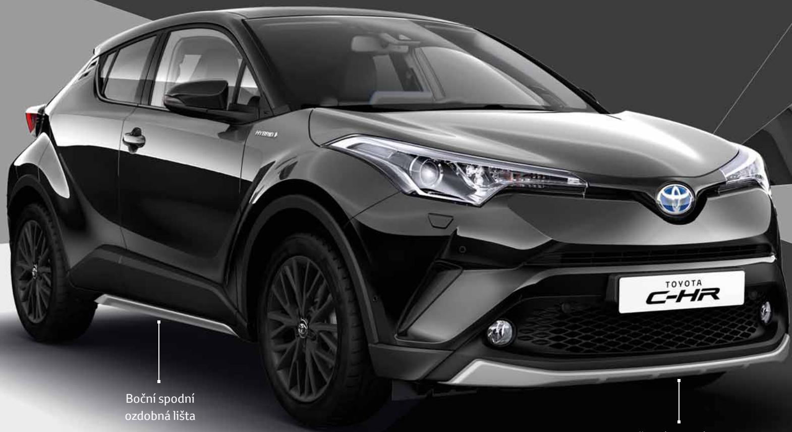
Boční spodní ozdobná lišta