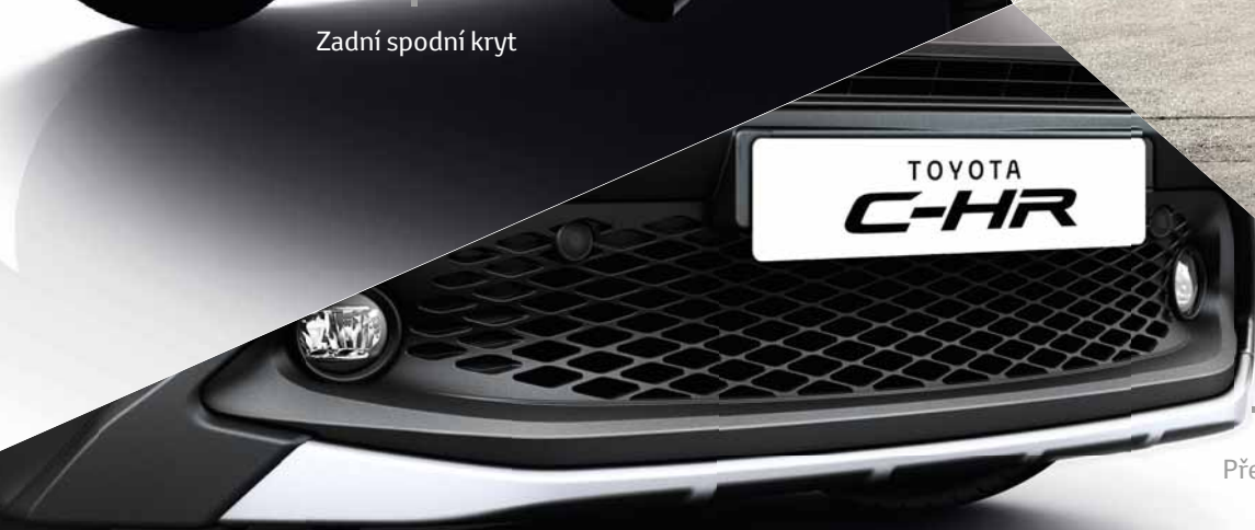
Přední spodní kryt