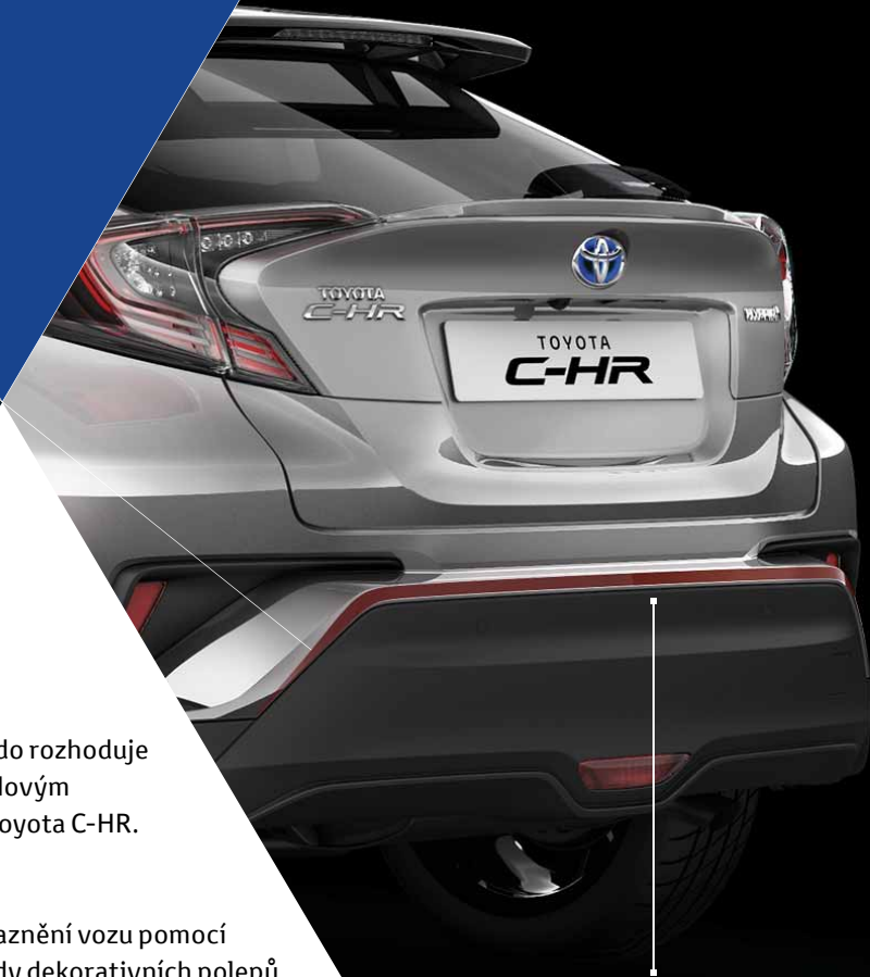
Červená dekorativní sada

Vyberte barevné zvýraznění vozu pomocí modré nebo červené sady dekorativních polepů (přední, boční a zadní) a samostatných středových krytek kol.