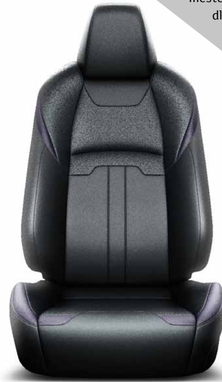
Černá kůže s purpurovými detaily