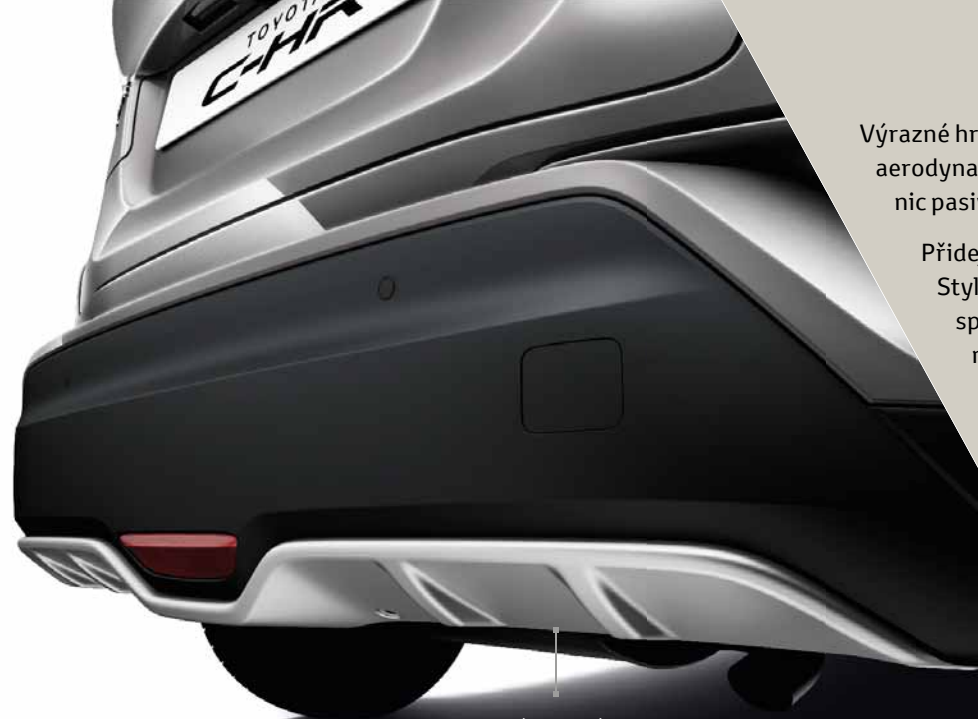
Zadní spodní kryt

Výrazné hrany, ostře řezané linie, elegantní aerodynamika. Na Toyotě C-HR nenajdete nic pasivního ani váhavého.