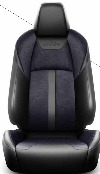
Černá perforovaná kůže Alcantara s modrým základem