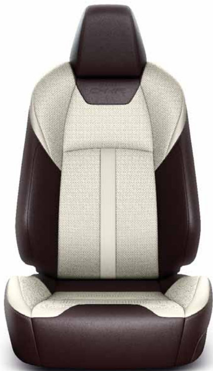
Hnědá a béžová perforovaná kůže

Kožené interiéry jsou k dispozici ve verzích Premium a Standard. Interiér Premium je celý vyrobený z přírodní kůže, zatímco Standard je vyroben částečně z přírodní kůže (přední část) a částečně ze syntetické kůže.