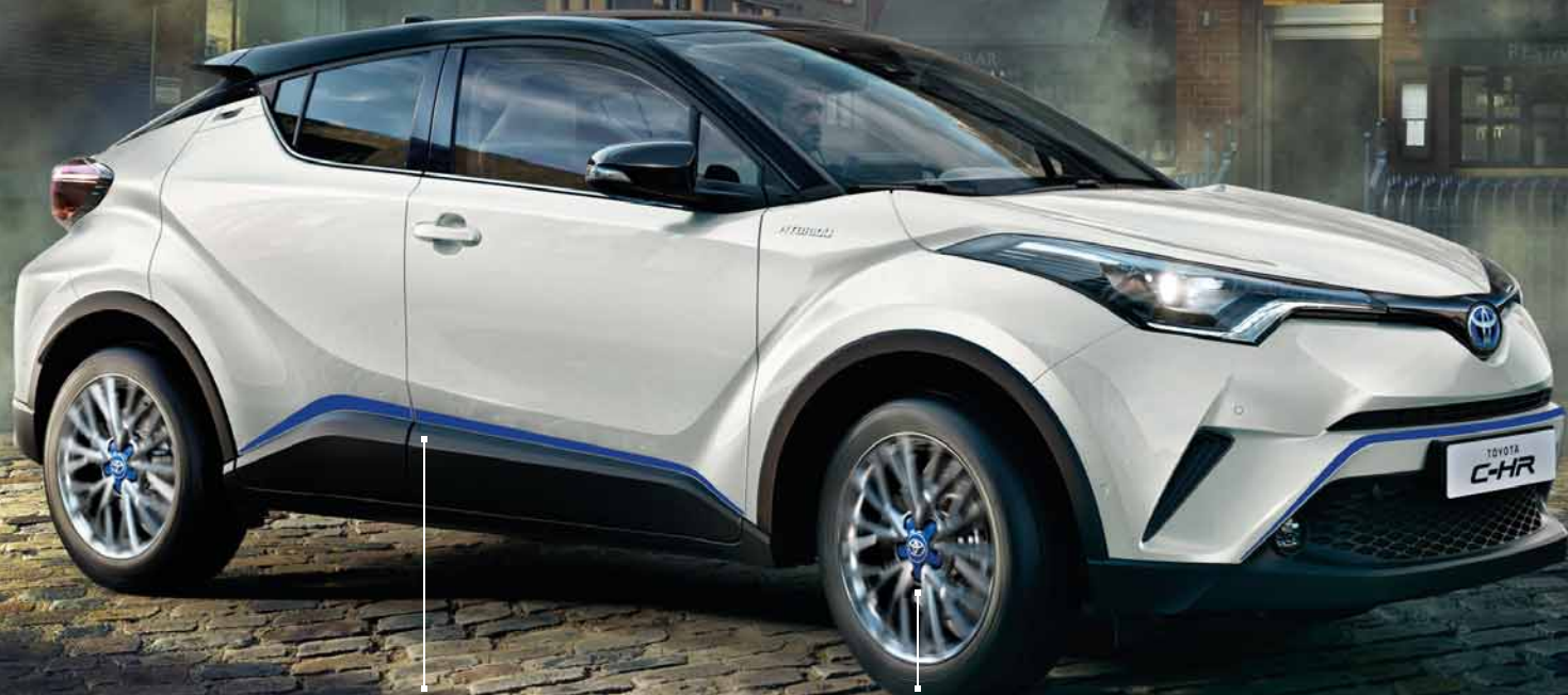
Modrá dekorativní sada