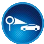
Systém rozpoznávání dopravních značek (RSA)