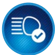
Automatická dálková světla (AHB)