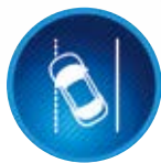
Upozornění na opuštění jízdního pruhu (LDA)