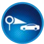
Systém rozpoznávání dopravních značek (RSA)