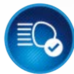
Automatická dálková světla (AHB)