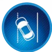
Systém upozornění na opuštění jízdního pruhu (LDA)