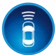
Předkolizní bezpečnostní systém (PCS)