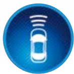
Předkolizní bezpečnostní systém (PCS)