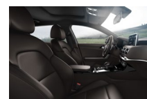
EX alap barna műbőr