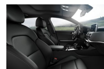
EX alap fekete műbőr