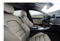
GT és GT Line szürke valódi bőr