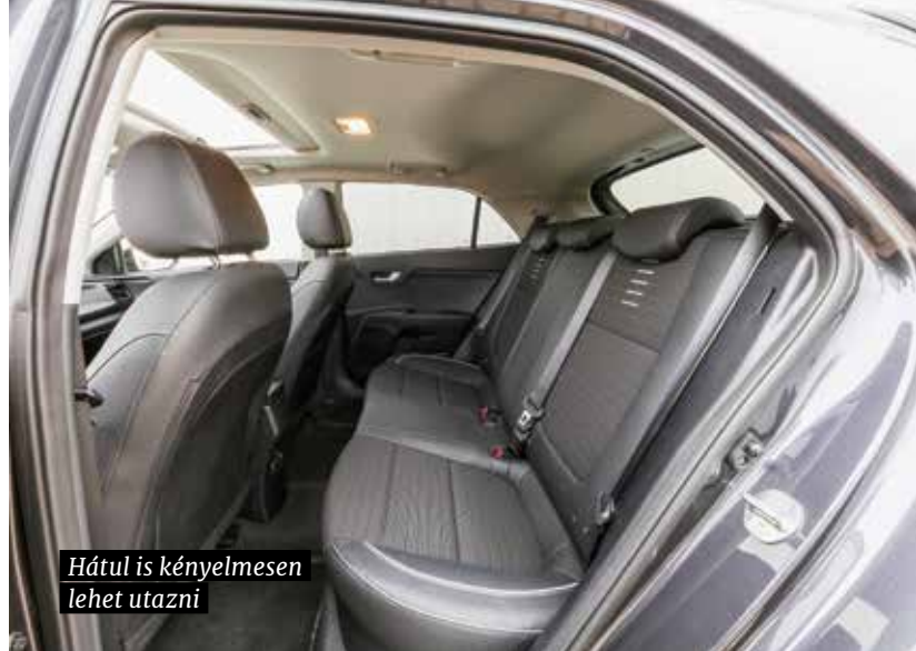
Hátul is kényelmesen lehet utazni

legkorszerűbb, az aktív biztonságot hatékonyan növelő vezetőasszisztensekkel. Ilyen a gyalogosfelismerős autonóm vészfék, a fáradtságérzékelő, a sávtartó, a távolsági fényszóró asszisztens és a holtérfigyelő. A GT Line autópályán sem jön zavarba, ám lételeme a város, ahol kihasználható a négy métert alig meghaladó hosszúság és az átlagon felüli manőverezhetőség minden előnye, a parkolástól kezdve a dinamikus képességekig. A felszereltség nagyvonalú, nem kell felárat fizetni az intelligens kulcsért, az automata légkondicionálóért, és az ülés- és kormányfűtésért sem. A Kia Rio GT Line azoknak való, akik úgy élnek, ahogy szeretnének: vidáman, aktívan, dinamikusan, csinosan, sportosan – aki magára ismer, ne habozzon, üljön a volán mögé!