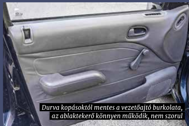
Durva kopásoktól mentes a vezetőajtó burkolata, az ablaktekerő könnyen működik, nem szorul

Valós 240 ezer kilométerrel az órájában, bontatlan motorral, eredeti fődarabokkal és a hétköznapi élet karcnyomait magán viselő, de ép karosszériával, a 23 éves Sephia újra eladósorba került – nem kellett sokáig hirdetni. Új gazdája merőben más szerepet szánt neki: négy jól megtermett, építkezésekre járó szakembereivel használja – ahogy ő fogalmaz – BKV helyett. És nagyon szeretik! Remekül elférnek, minden berendezés működik, hátul van hely a szerzőknek, az erős motorral pedig szállnak, mint a távirat. A kapcsolat hosszú távúnak ígérkezik, még szűk 2 év van a következő vizsgáig, de az öreg Kiára utána is számít a tulajdonos. Hogy óvja, hamarosan huzatokat tesz az eredeti, még szakadásmentes üléskárpitokra, kicseréli a műszerfal repedt felső borítását, és fontolgatja a karosszéria teljes átfényezését is. Ha rajta múlik, a Sephia büszkén léphet be a veteránok táborába. ■