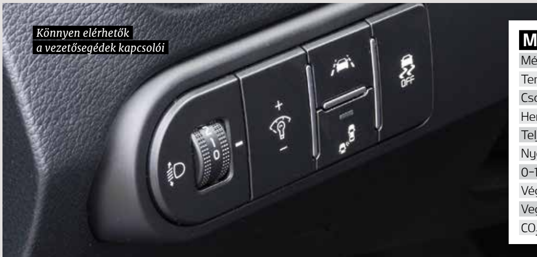
Könnyen elérhetők a vezetések kapcsolói