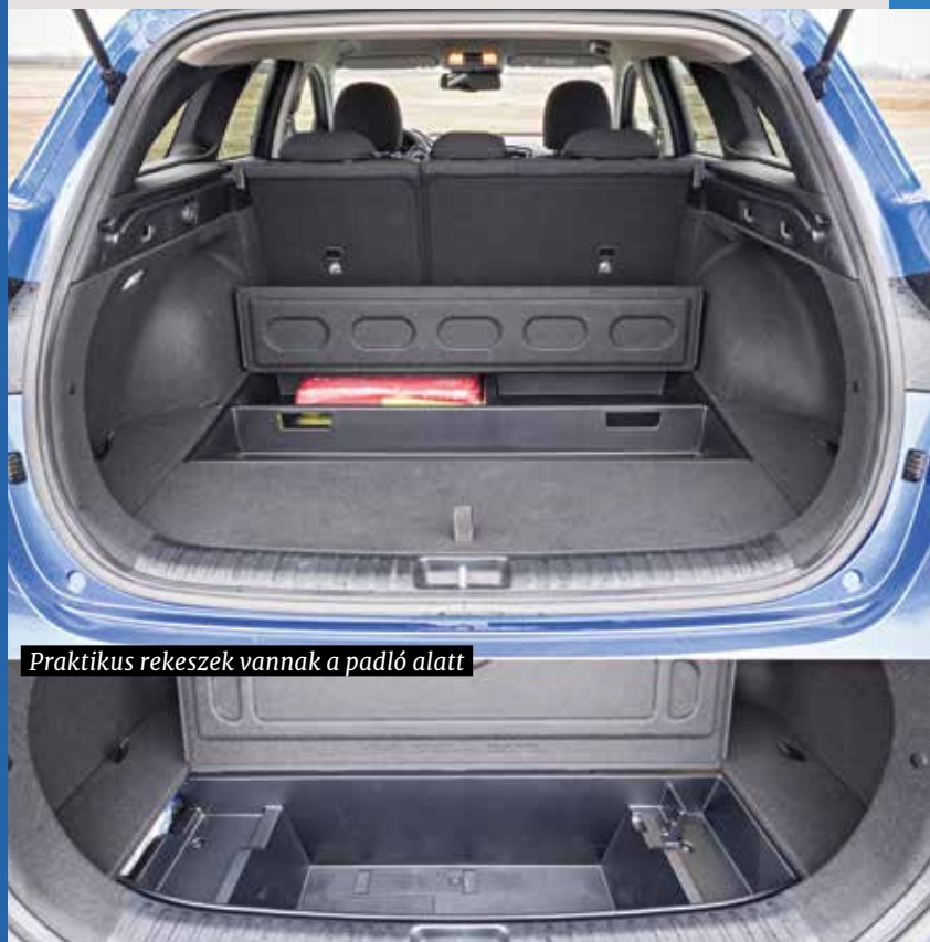
Praktikus rekeszek vannak a padló alatt