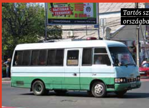
Tartós szerkezetű a Combi, sok országban ma is róják az utakat

bízták, az L7 és L7A jelű gázolajos erőforrások 7,4 literes hengerűrtartalmából állítottak elő 177 LE-s teljesítményt, az erőátvitel a Combival megegyezően kézi sebességváltóval és hátsókerék-hajtással történt. 1994-ben szintet lépett a vállalat, megszületett a normál és az emelt padlószintű (SD, HD)