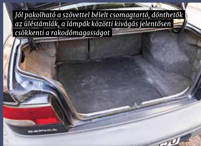
Jól pakolható a szövetvel bélelt csomagtartó, dönthetők az üléstámlák, a lámpák közötti kivágás jelentősen csökkenti a rakodómagasságot