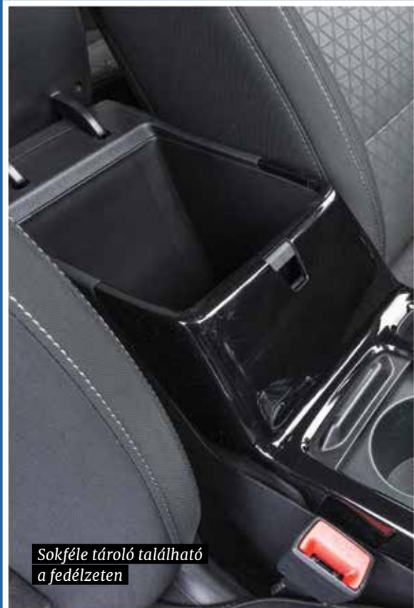
Sokféle tároló található a fedélzeten

valóban sportos karakterre vágyik, elegendő megnyomnia a középkonzolon található Sport feliratú gombot. Ekkor még élénkebb lesz a gázreakció, illetve, ha kézi helyett hétfokozatú, duplakuplungos DCT váltóval van szerelve az autó, akkor a kapcsolások is érezhetően gyorsabban történnek, lejtőn és gázelvételkor hatékonyabb motorfékkel.