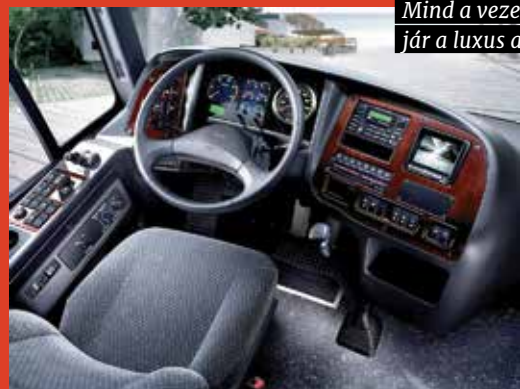
Mind a vezetőknek, mind az utasoknak jár a luxus a Granbird fedélzetén