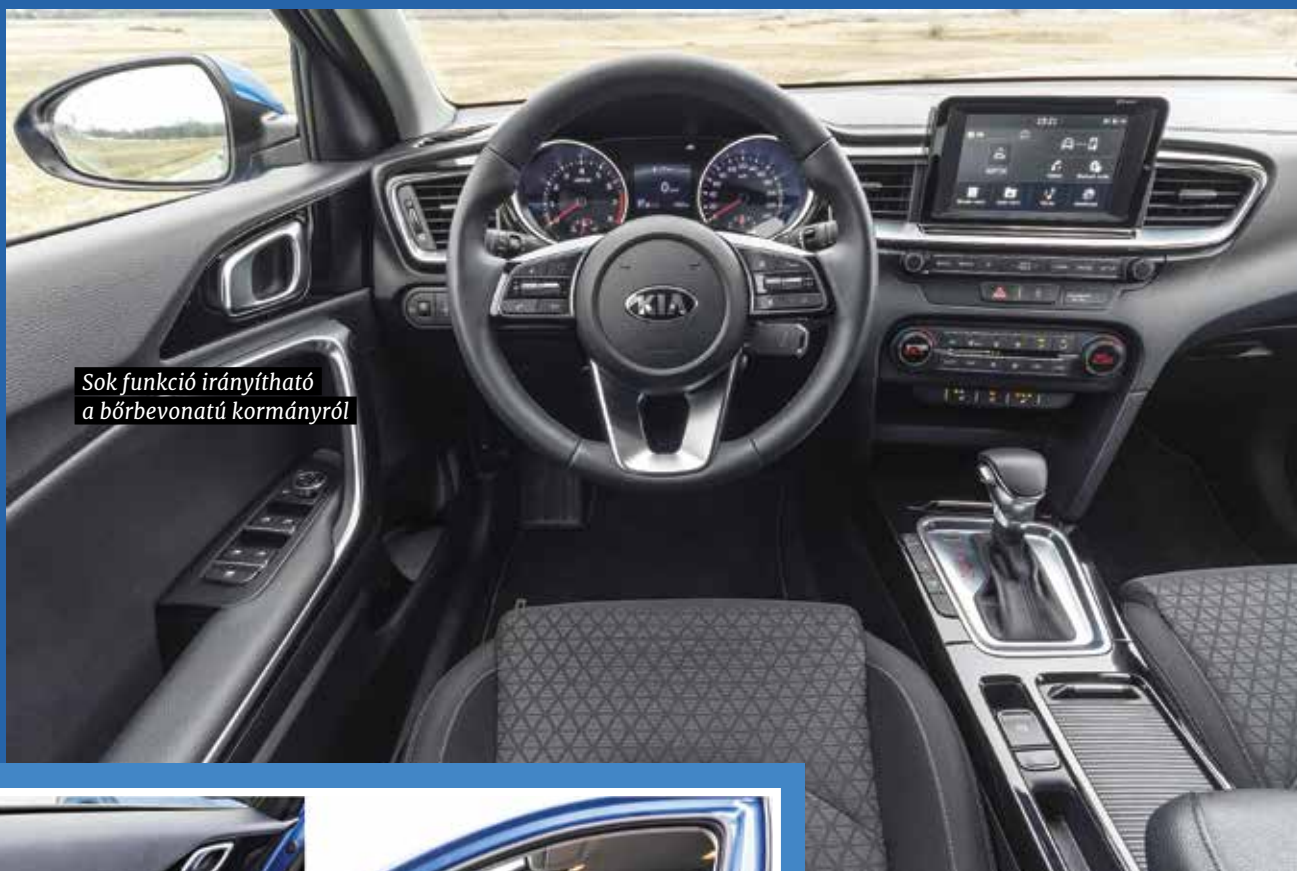
Sok funkció irányítható a bőrbevonatú kormányról

a kormányt és a váltókart kellemes tapintású bőr borítja. Az SW csomagtartója valóban hatalmas: már alaphelyzetben 625 l-es a befogadóképesség, amit az üléstámlák ledöntésével 1694 l-ig lehet növelni! A támlák a variálhatóság érdekében akár 40:20:40 arányban osztottak, a padló alatt és a széleken több rekesz található, a rakodóperem pedig 5 centivel alacsonyabb, mint az ötajtós Ceednél, így