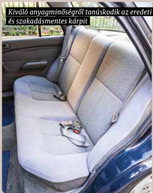
Kiváló anyagminőségről tanúskodik az eredeti és szakadásmentes kárpit