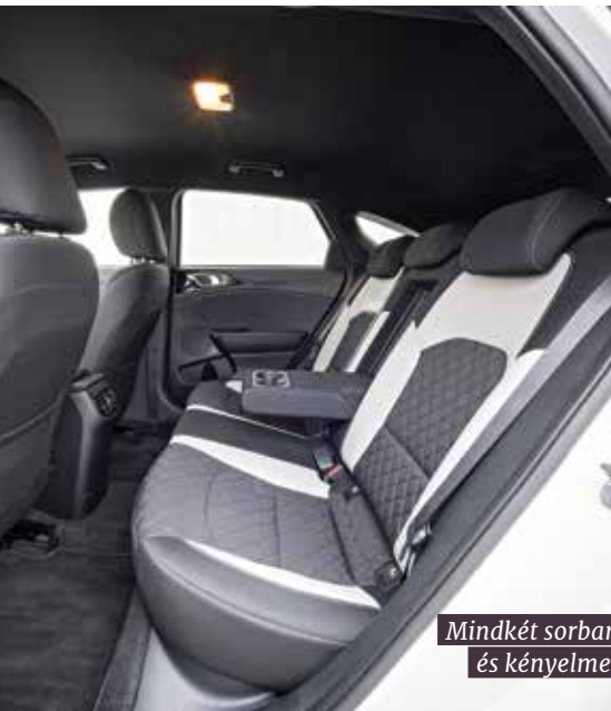
Mindkét sorban bőséges a hely és kényelmesek az ülések