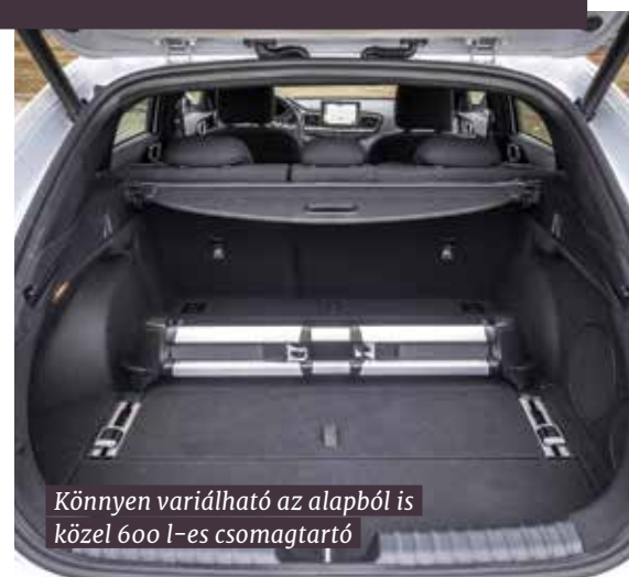
Könnyen variálható az alapból is közel 600 l-es csomagtartó

a mérnökök aprólékosan beállíthassák a felfüggesztést, a kormányzást és minden egyéb szükséges dolgot. A gyakorlatban most megmutatkozott ennek a munkának az eredménye: a ProCeed vezetése valóban csúcsmodellhez illő élmény! A futóművek alapjai megegyeznek a normál Ceedével, azaz elől MacPherson, hátul multilink a konstrukció, de mások a rugók, a lengéscsillapítók, és megerősítették a bekötési pontokat is. A kormánymű áttételezése közvetlenebb, a fék hatékonyabb lett. És mit érez mindezekből a vezető? A ProCeed precízen követi a kijelölt irányt, hibátlan az egyenesfutása, kanyarban nagy tempónál is fölényes stabilitást mutat, és magabiztosan áll meg. Megnyomva a középkonzolon található Sport gombot, tovább élénkül a gázreakció, a váltó hagyja magasabb fordulaton pörögni a motort, később és gyorsabban történnek a kapcsolások, valamint megváltozik a kormányrásegítés ereje is, ami szintén hozzájárul a közvetlenebb kezelhetőség érzéséhez.