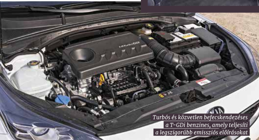
Turbós és közvetlen befecskendezéses a T-GDi benzines, amely teljesíti a legszigorúbb emissziós előírásokat