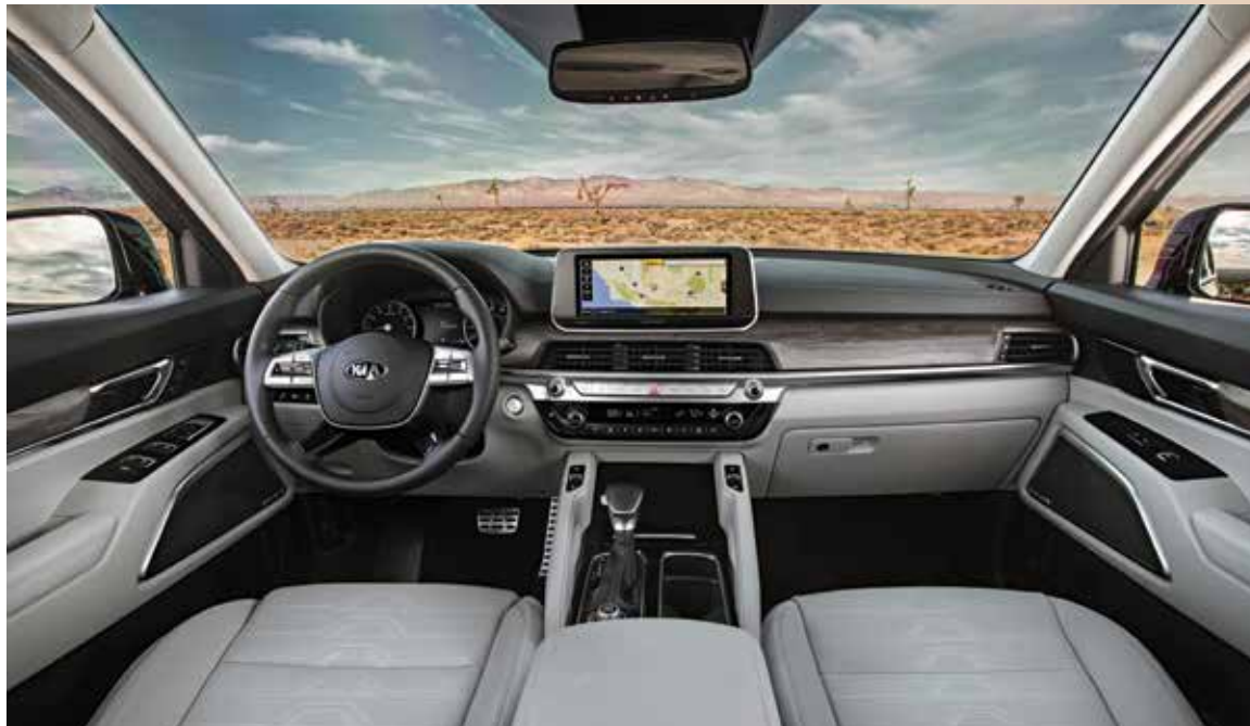
Rengeteg hely, prémium-minőségű anyagok, kiváló összeszerelési minőség