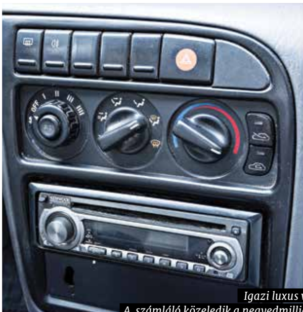
Igazi luxus volt 1996-ban a légkondicionáló. A számláló közeledik a negyedmillió kilométerhez, minden kapcsoló és berendezés működik, a fényszóró belülről állítható