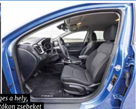
Bőséges a hely, az ajtókon zsebeket alakítottak ki