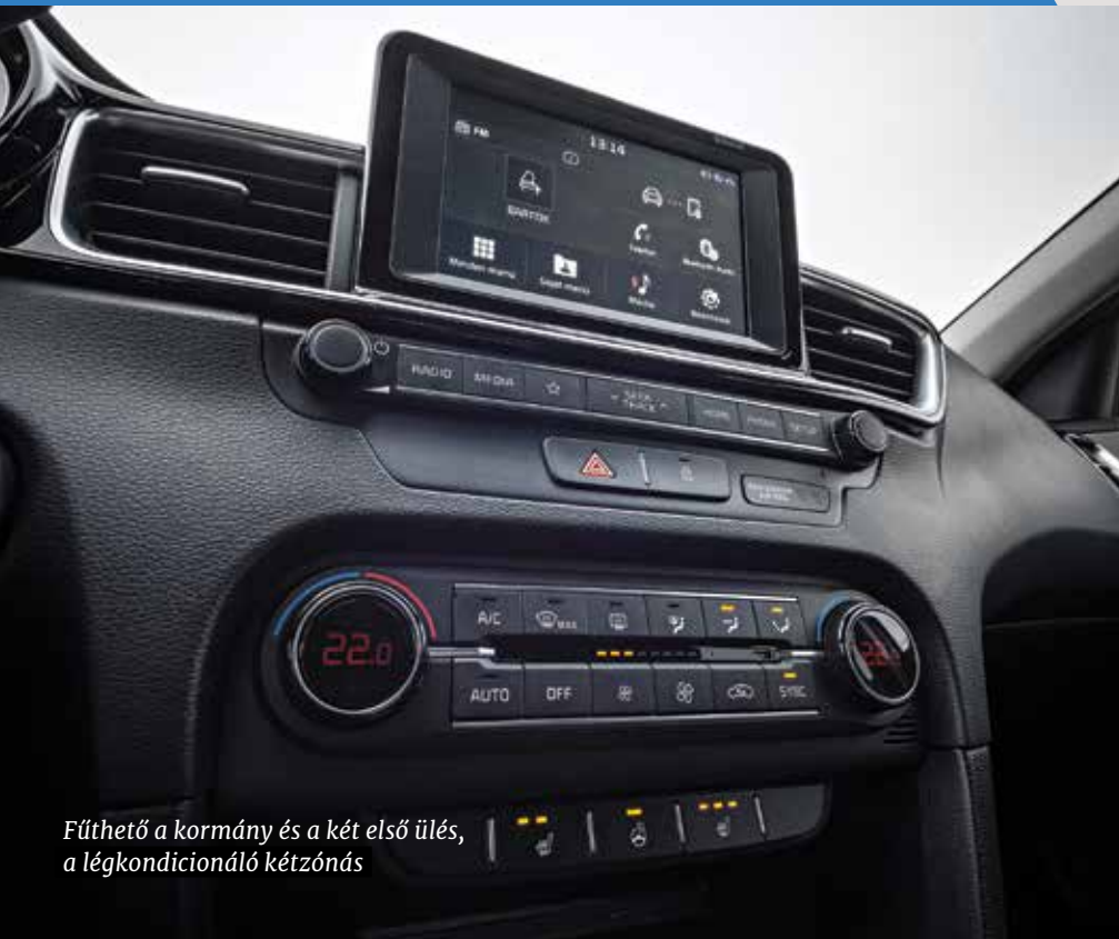
Fűthető a kormány és a két első ülés, a légkondicionáló kétfázisú