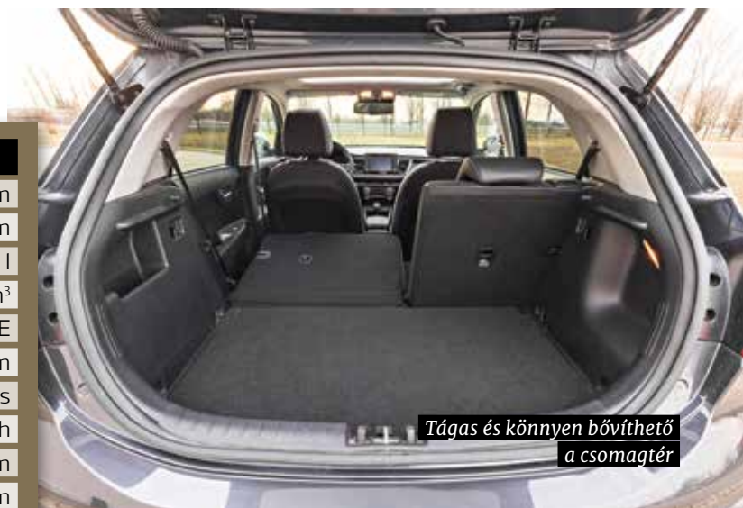
Tágas és könnyen bővíthető a csomagtér