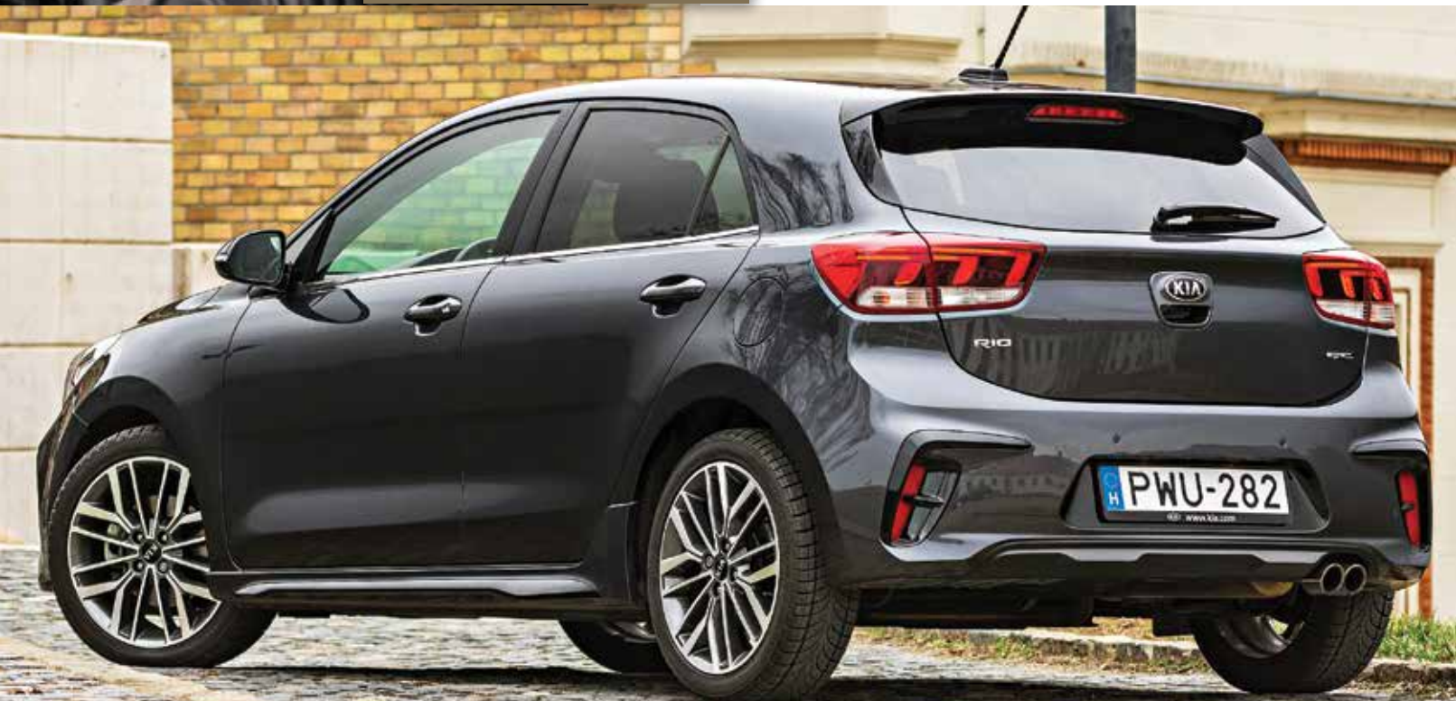
GT Line-jellemző a 17 colos alufelni és a kettős végződésű kipufogó