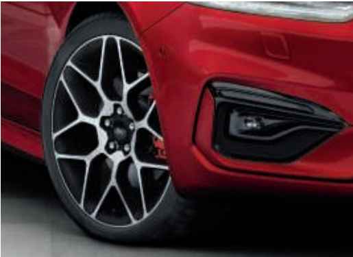
19" kola z lehkých slitin se 7x2 paprsky a červenými brzdovými třmeny (výbava na přání)