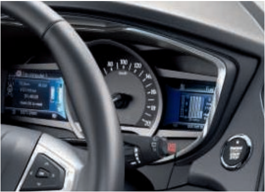
Palubní počítač s 2 x 4,2" barevným displejem pro hybrid