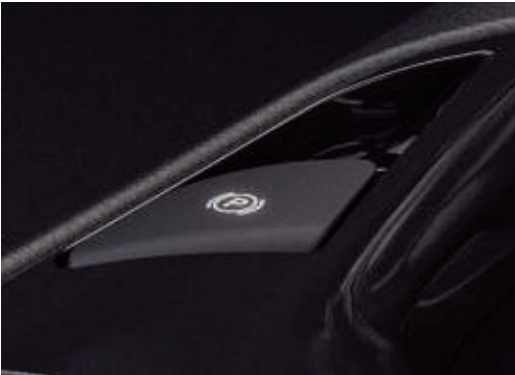
Elektronická parkovací brzda