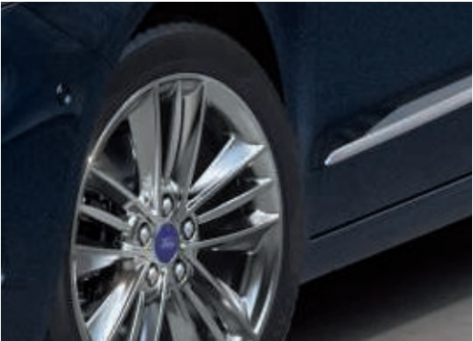
18" kola z lehkých slitin s 5x3 paprsky