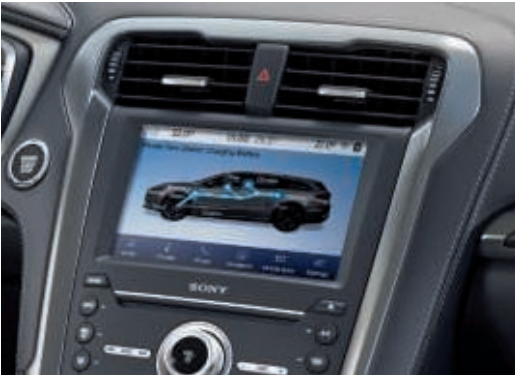
Rádio, CD přehrávač a systém SYNC 3 s barevným 8" dotykovým displejem