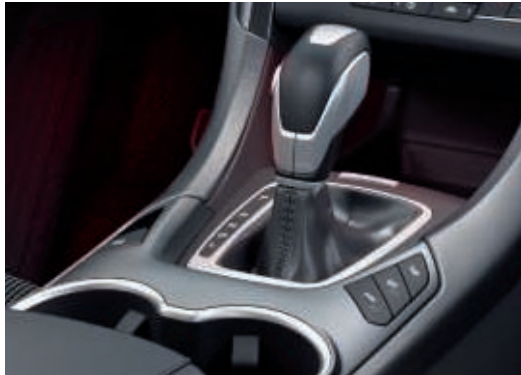
Automatická převodovka CVT pro hybrid