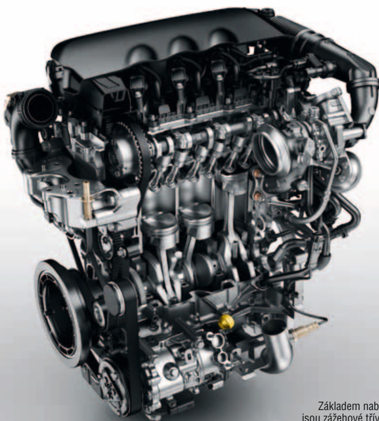
Základem nabídky jsou zážehové tříválce 1.2 PureTech řady EB2

▼ Samočinná převodovka EAT6 s kapalinovým měničem momentu nahradila robotizované mechanické verze