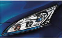
MODRÁ (P) - BW9