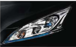
ČERNÁ (M) - GNO