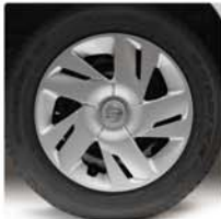
15" OCELOVÁ S KRYTY