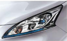
STŘÍBRNÁ (M) - KLO