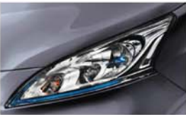
ŠEDÁ LIGHT (PM) - K51