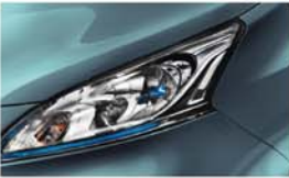
MODRÁ (TPM) - RBM