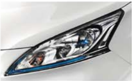
BÍLÁ (S) - QM1