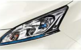
BÍLÁ (3P) - QAB