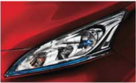
ČERVENÁ (S) - Z10