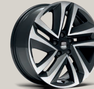
Broušená 18" kola Performance