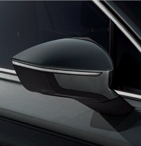
Camouflage Zelená 3,4 St XE FR