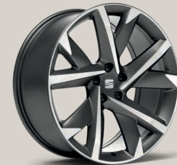
Broušená, matná 20" kola Supreme FR