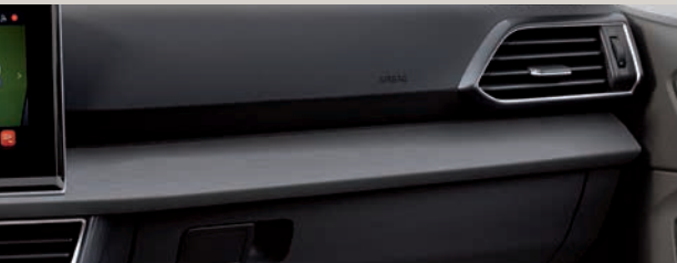
Černá kůže Vienna