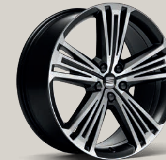
Broušená, matná 20" kola Supreme