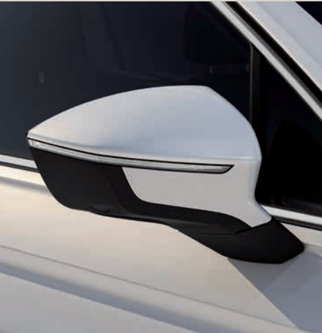
Oryx Bílá 3,4 St XE FR