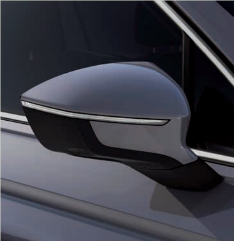
Dolphin Šedá 2,4 St XE FR