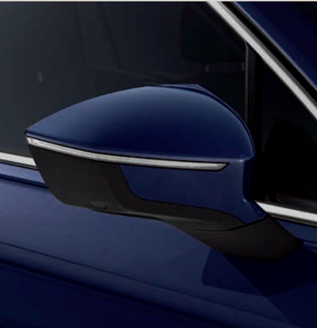
Atlantic Modrá 2 St XE