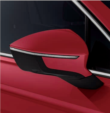
Merlot Červená 2,4 St XE FR