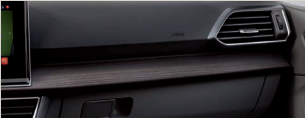
Černá kůže Vienna