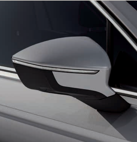
Reflex Stříbrná 2 St XE