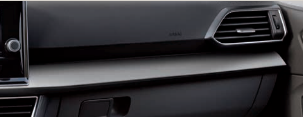
Tkanina Olota s ozdobnými plochami z černého materiálu Alcantara®