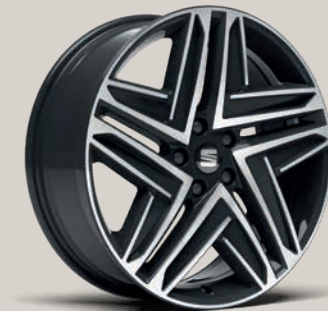
Broušená 19" kola Exclusive