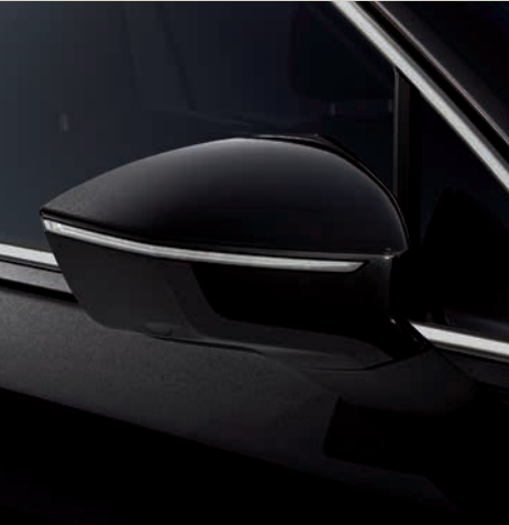
Deep Černá 2,4 St XE FR

Style St Xcellence XE FR FR Standardní výbava ■ Výbava na přání ■