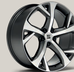
Broušená 19" kola Exclusive FR