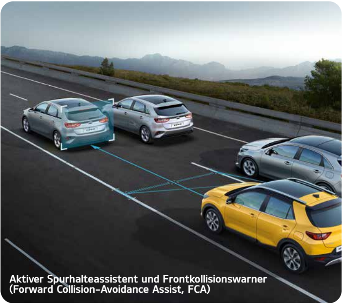
Aktiver Spurhalteassistent und Frontkollisionswarner (Forward Collision-Avoidance Assist, FCA) A* Der aktive Spurhalteassistent mit korrigierendem Lenkeingriff (Lane Keeping Assist, LKA) erkennt per Kamera, ob der Kia Rio unbeabsichtigt seine Fahrspur verlässt. In dem Fall weist das System den Fahrer darauf hin und lenkt gleichzeitig geringfügig gegen, um das Fahrzeug in der Spur zu halten.

Wenn die Ultraschallsensoren im Front- und Heckstoßfänger beim Parkmanövern ein Hindernis erkennen, macht ein Warnton – der sich auch abschalten lässt – den Fahrer darauf aufmerksam.