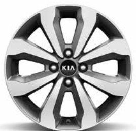
16-Zoll- Leichtmetallfelgen mit Bereifung 195/55 R16 (Vision und 1.2 Spirit)