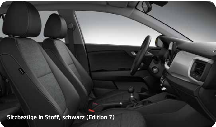
Sitzbezüge in Stoff, schwarz (Edition 7)