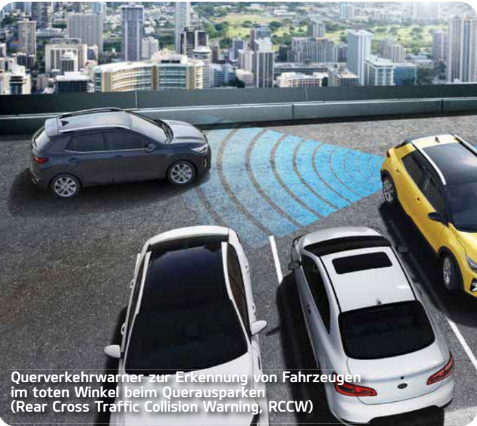
Querverkehrwarner zur Erkennung von Fahrzeugen im toten Winkel beim Querausparken (Rear Cross Traffic Collision Warning, RCCW) A*

Der Frontkollisionswarner (Forward Collision-Avoidance Assist, FCA) A* erkennt neben Fahrzeugen auch Fußgänger auf der Fahrbahn. Das System ermittelt mit einer Kamera und mit Radarsensoren die Entfernung und Geschwindigkeit der Objekte. Droht eine Kollision, warnt es den Fahrer. Falls keine Reaktion erfolgt, löst der Frontkollisionswarner eigenständig eine Notbremsung aus.