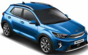
Bathysblau Met. _ SPB