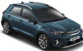
Denimblau Met. _ EU3