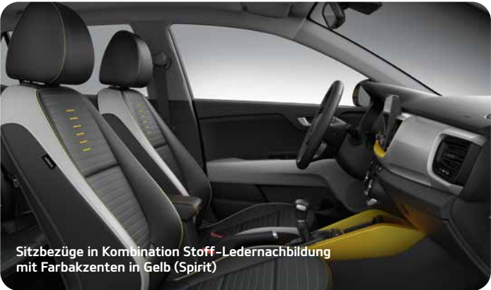
Sitzbezüge in Kombination Stoff-Ledernachbildung mit Farbakzenten in Gelb (Spirit)