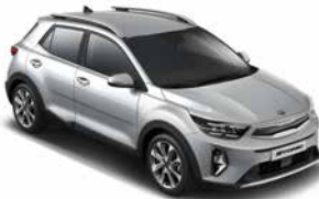
Seidensilber Met. _ 4SS