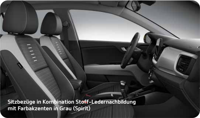
Sitzbezüge in Kombination Stoff-Ledernachbildung mit Farbakzenten in Grau (Spirit)