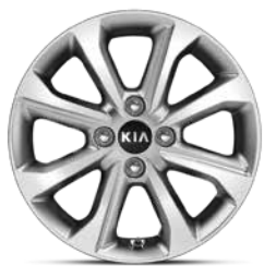
15-Zoll- Leichtmetallfelgen mit Bereifung 185/65 R15 (Edition 7)