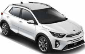
Schneeweiß _ UD

Die kraftvollen, frischen Außenfarben des Kia Stonic bringen sein Design und seine markanten Konturen optimal zur Geltung.