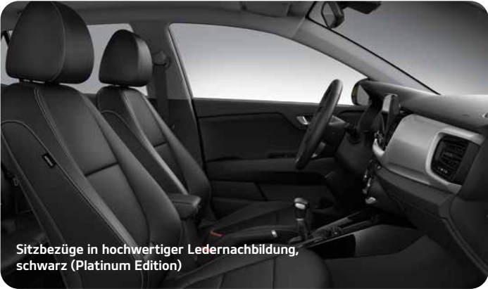
Sitzbezüge in hochwertiger Ledernachbildung, schwarz (Platinum Edition)

Der Kia Stonic ist je nach Ausführung erhältlich mit Sitzbezügen aus Stoff in Schwarz oder wahlweise mit Kombination Stoff-Ledernachbildung und Akzenten in Blau, Gelb oder Grau. Die Version Platinum Edition verfügt über Sitze aus hochwertiger Ledernachbildung.