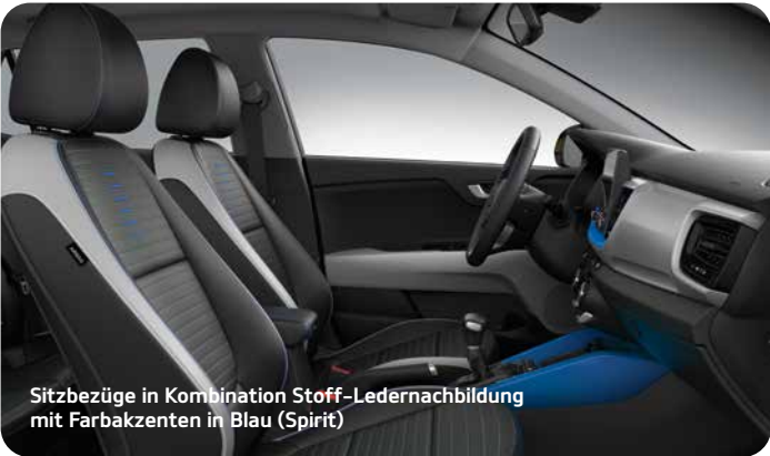
Sitzbezüge in Kombination Stoff-Ledernachbildung mit Farbakzenten in Blau (Spirit)