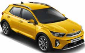
Floridagelb Met. _ MYW