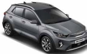
Perennialgrau Met. _ PRG