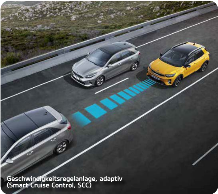
Geschwindigkeitsregelanlage, adaptiv (Smart Cruise Control, SCC) A*

Die Verkehrszeichenerkennung für Geschwindigkeitsbegrenzungen (Intelligent Speed Limit Warning, ISLW) erkennt per Kamera Schilder mit Tempolimits und Überholverboden und zeigt diese Informationen in der Instrumenteneinheit und auf dem Bildschirm des Navigationssystems + an.