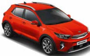
Signalrot Met. _ BEG