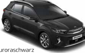
Auroraschwarz Met. (ABP)