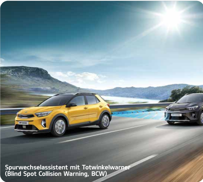
Spurwechselassistent mit Totwinkelwarner (Blind Spot Collision Warning, BCW) A*

Im Kia Stonic können Sie sich rundum sicher fühlen: Moderne Assistenzsysteme A unterstützen Sie dabei, in Gefahrensituationen schnell und angemessen zu reagieren.