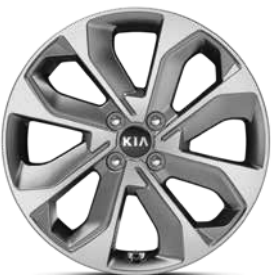
17-Zoll- Leichtmetallfelgen mit Bereifung 205/55 R17 (Spirit, außer 1.2, und Platinum Edition)

Bei einigen unserer modernen Metallicfarben werden bewusst unterschiedliche Farbpigmente verwendet. Dadurch können unter bestimmten Lichtverhältnissen, z. B. direktes Sonnenlicht, attraktive Farbeffekte erzielt werden. Zum Teil kann die Farbe changieren, z. B. von Schwarz zu Dunkelblau. Bei den hier abgebildeten Farbdarstellungen kann es aufgrund der Drucktechnik zu Abweichungen zu den Originalfarben kommen. Weitere Informationen zu den Farbeffekten und Grundfarben gibt Ihnen gerne Ihr Kia-Vertragshändler. Metalliclackierungen sind aufpreispflichtig.