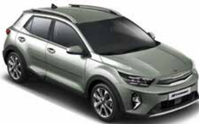
Urbangrün Met. _ URG