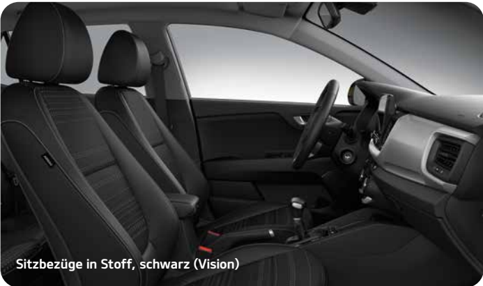
Sitzbezüge in Stoff, schwarz (Vision)