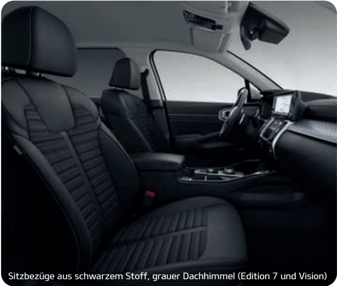
Sitzbezüge aus schwarzem Stoff, grauer Dachhimmel (Edition 7 und Vision)

Abbildungen zeigen kostenpflichtige Sonderausstattung. Darstellung: Repräsentation für Sitzkonfiguration.