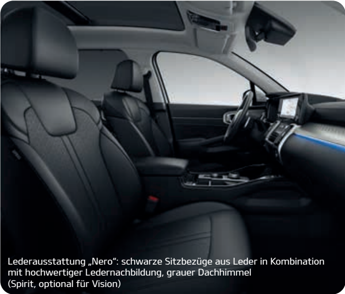
Lederausstattung „Nero“: schwarze Sitzbezüge aus Leder in Kombination mit hochwertiger Ledernachbildung, grauer Dachhimmel (Spirit, optional für Vision)