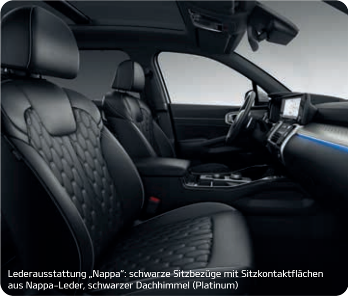
Lederausstattung „Nappa“: schwarze Sitzbezüge mit Sitzkontaktflächen aus Nappa-Leder, schwarzer Dachhimmel (Platinum)

Der Kia Sorento zeigt sich im Interieur ebenso elegant und stilvoll wie im äußeren Auftritt. Das Ausstattungsspektrum beinhaltet neben hochwertigen schwarzen Stoffsitzen drei verschiedene Ledervarianten: in Schwarz, zweifarbig in Schwarz-Hellgrau sowie in Schwarz mit Sitzkontaktflächen in Nappa-Leder.