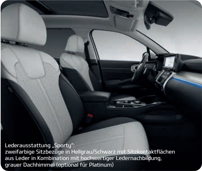
Lederausstattung „Sporty“: zweifarbige Sitzbezüge in Hellgrau/Schwarz mit Sitzkontaktflächen aus Leder in Kombination mit hochwertiger Ledernachbildung, grauer Dachhimmel (optional für Platinum)