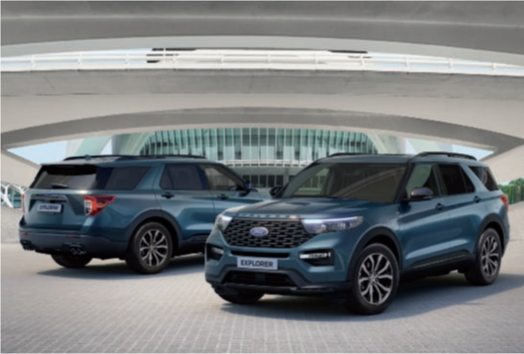
Explorer ST-Line v barvě laku modrá Metallic (za příplatek).

Plug-in hybridní pohon 3.0 V6 EcoBoost Hybrid (PHEV) AWD