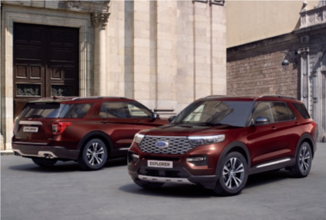
Explorer Platinum v barvě laku červená Rich Copper (za příplatek).