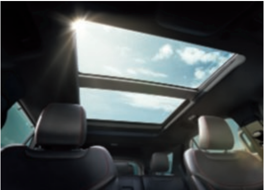
Elektricky ovládané panoramatické dvoudílné střešní okno (standardní výbava).