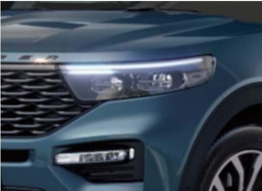
Adaptivní LED světlomety sportovně zatmavené.