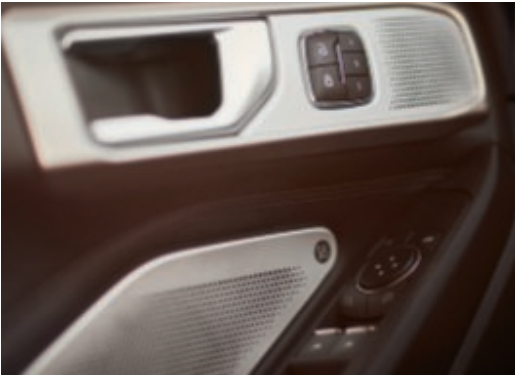
Prémiový audiosystém B&O se 14 reproduktory včetně subwooferu.