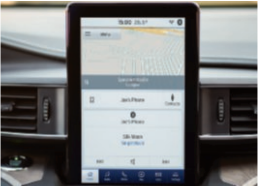
10,1" barevný dotykový displej, na výšku.