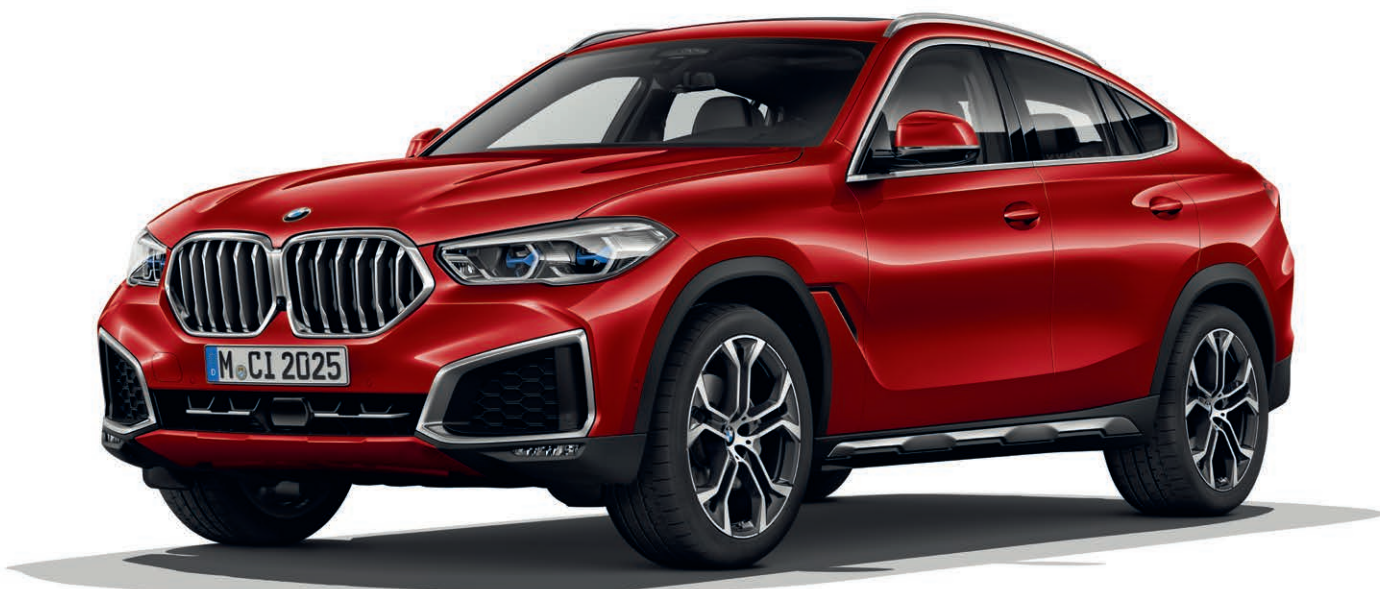
7HW xLine - BMW X6 xDrive40i, metalický lak Flamenco Red (volitelná výbava), 21" kola z lehké slitiny Y-spoke 744 (volitelná výbava)