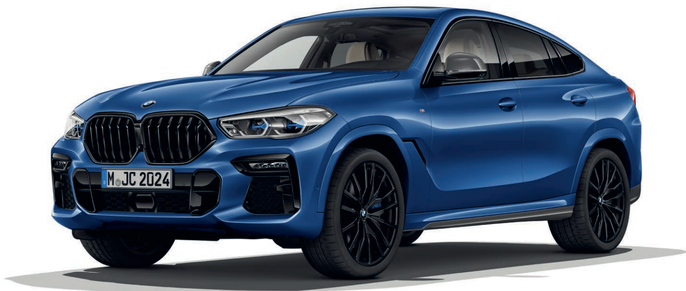
337 - M sportovní paket - BMW X6 xDrive40i, metalický lak Riverside Blue (volitelná výbava), 22" M kola z lehké slitiny Double-spoke 742 M, Jetblack (volitelná výbava), BMW Individual high-gloss Shadow Line s rozšířeným obsahem (volitelná výbava), M karbonové kryty vnějších zpětných zrcátek (volitelná výbava)