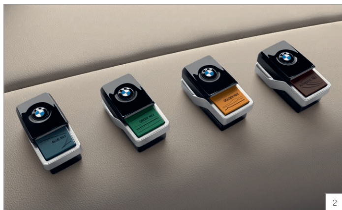
4NM – Paket Ambient Air

Obrázky jsou ilustrativní. Změny v obsahu, jakož i tiskové chyby a omyly jsou vyhrazeny.