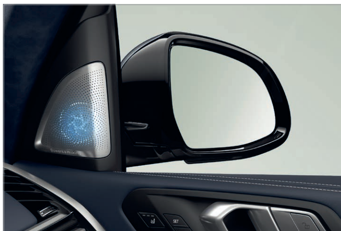
6F1 – Bowers & Wilkins Diamond Surround Sound Systém