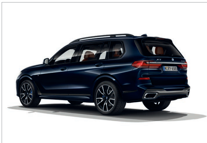
BMW X7 xDrive40i, BMW Individual high-gloss Shadow Line a koncovky výfuku specifické pro M sportovní paket

Obrázky jsou ilustrativní. Změny v obsahu, jakož i tiskové chyby a omyly jsou vyhrazeny.