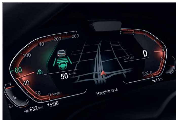
5AU – Driving Assistant Professional