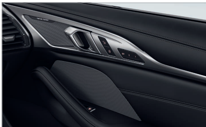
688 – Harman Kardon Surround Sound System