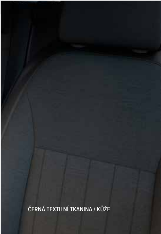
ČERNÁ TEXTILNÍ TKANINA / KŮŽE