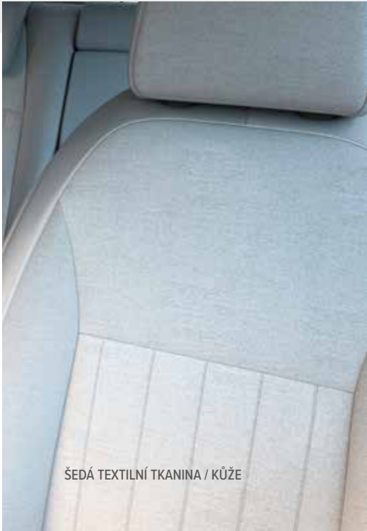
ŠEDÁ TEXTILNÍ TKANINA / KŮŽE