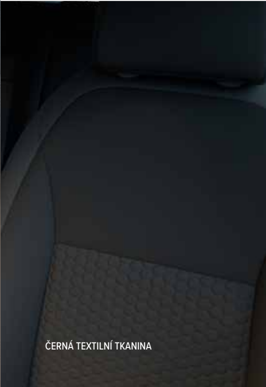
ČERNÁ TEXTILNÍ TKANINA

Barevné kombinace exteriéru a čalounění interiéru se u jednotlivých verzí liší. Více informací vám sdělí dealer společnosti Honda.