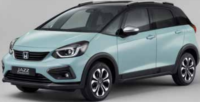
SURF BLUE / DVOUTÓNOVÁ VARIANTA