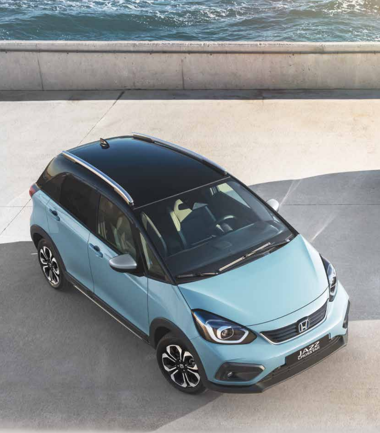
Na snímku je model Jazz Crosstar 1,5 i-MMD Executive s dvoutónovou karoserií v barvách Surf Blue a perleťová Crystal Black.

◆ standardní výbava – není v nabídce ◇ volitelně