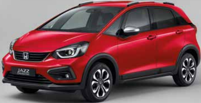
PRÉMIOVÁ METALICKÁ CRYSTAL RED