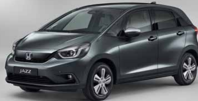
METALICKÁ SHINING GRAY