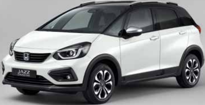
PERLEŤOVÁ PLATINUM WHITE / DVOUTÓNOVÁ VARIANTA