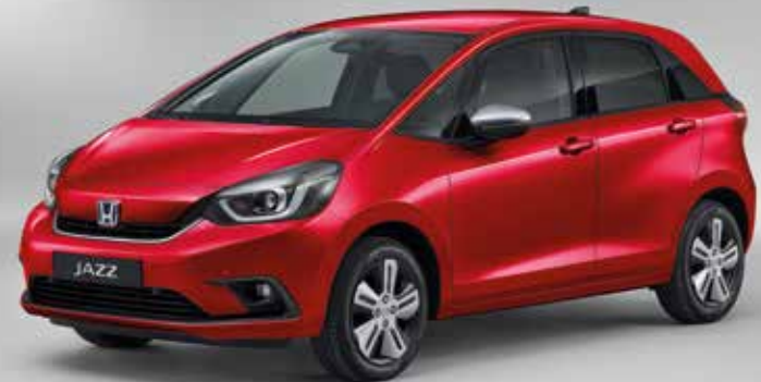
PRÉMIOVÁ METALICKÁ CRYSTAL RED