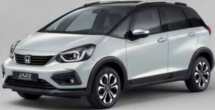
PRÉMIOVÁ PERLEŤOVÁ SUNLIGHT WHITE / DVOUTÓNOVÁ VARIANTA