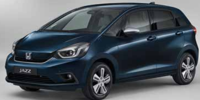
METALICKÁ MIDNIGHT BLUE BEAM