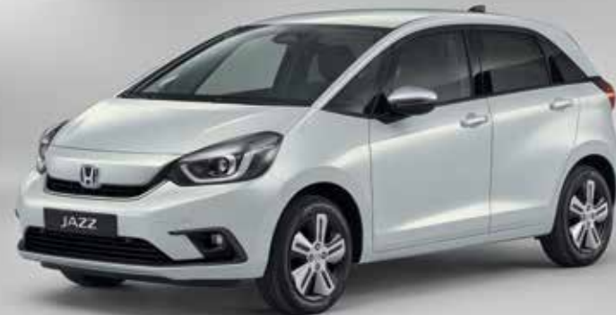
PRÉMIOVÁ PERLEŤOVÁ SUNLIGHT WHITE