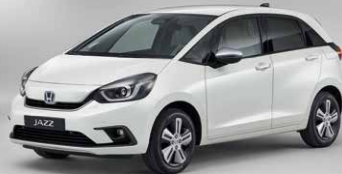
PERLEŤOVÁ PLATINUM WHITE