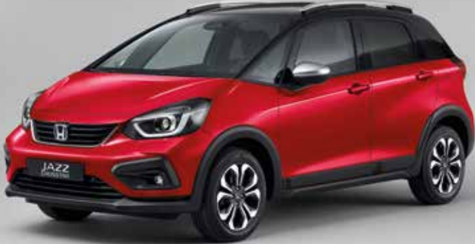
PRÉMIOVÁ METALICKÁ CRYSTAL RED / DVOUTÓNOVÁ VARIANTA