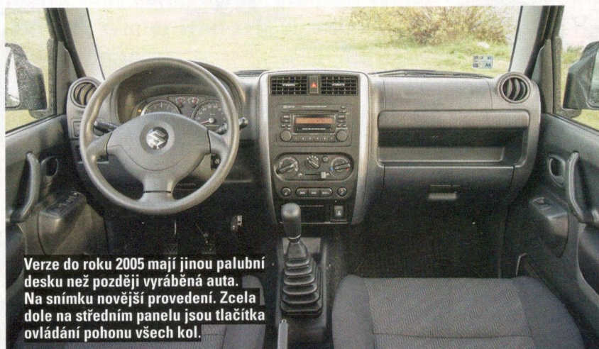
Verze do roku 2005 mají jinou palubní desku než později vyráběná auta. Na snímku novější provedení. Zcela dole na středním panelu jsou tlačítka ovládání pohonu všech kol.