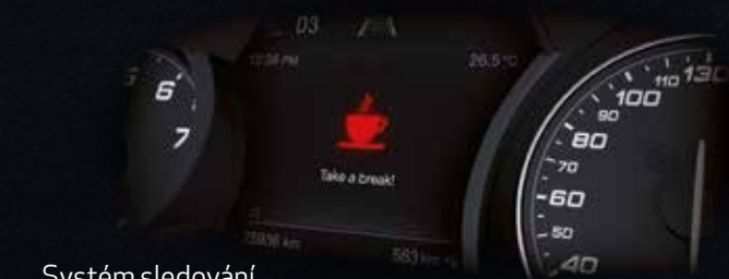
Systém sledování únavy řidiče