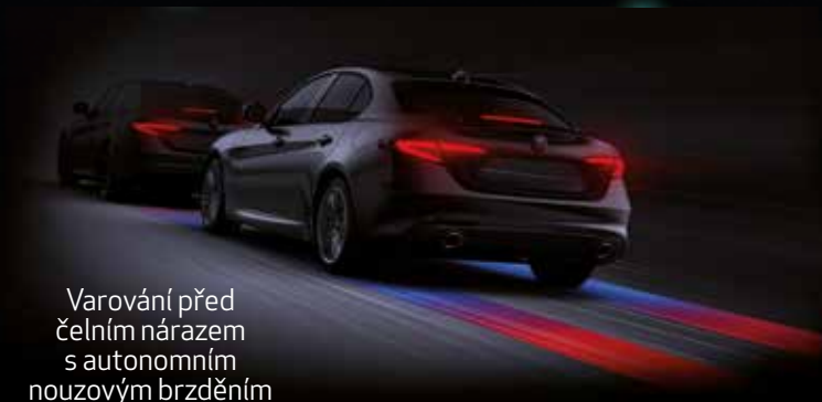
Varování před čelním nárazem s autonomním nouzovým brzděním