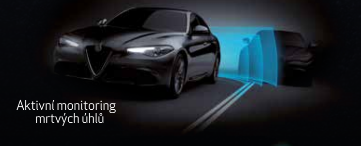
Aktivní monitoring mrtvých úhlů