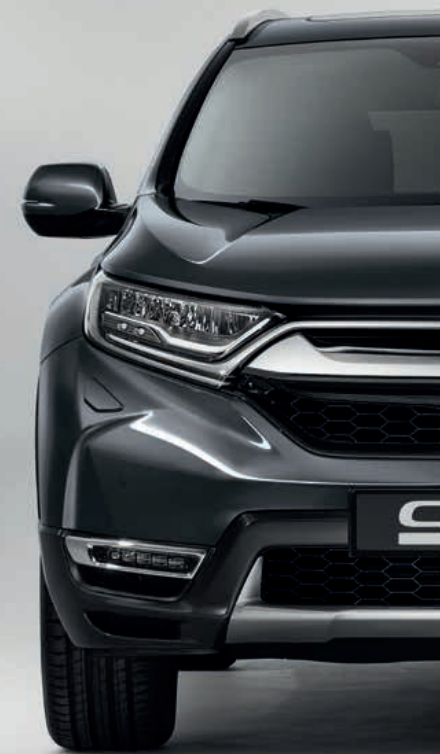
METALICKÁ MODERN STEEL