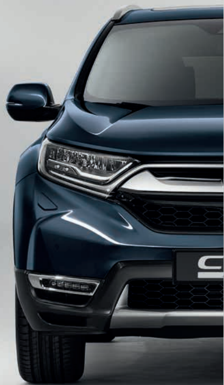
METALICKÁ COSMIC BLUE