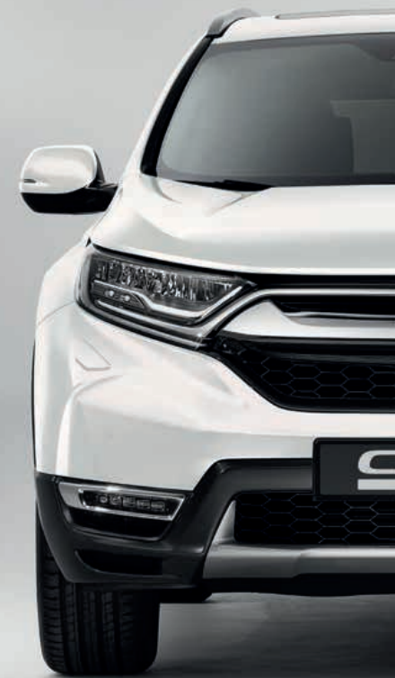
PERLEŤOVÁ PLATINUM WHITE