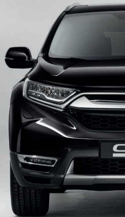
PERLEŤOVÁ CRYSTAL BLACK