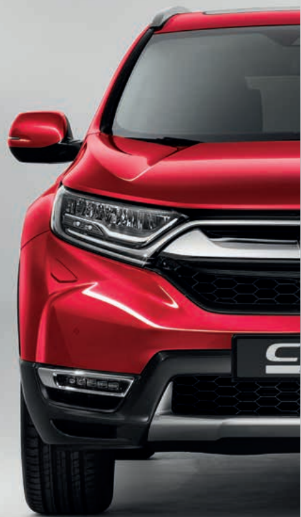
METALICKÁ PREMIUM CRYSTAL RED*

Každá barva byla vytvořena, aby dokonale doplňovala styl vozu CR-V. Vám stačí vybrat si podle svých představ.