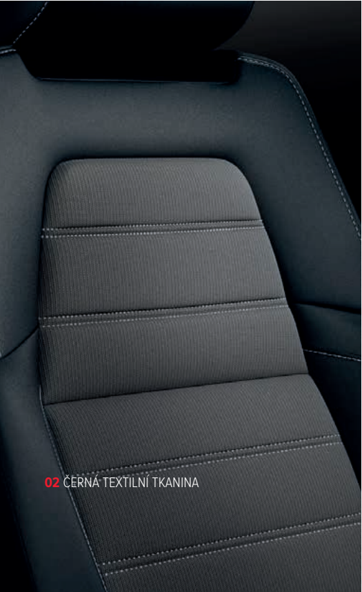
02 ČERNÁ TEXTILNÍ TKANINA