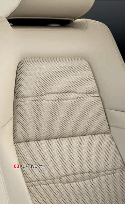
03 KŮŽE IVORY*