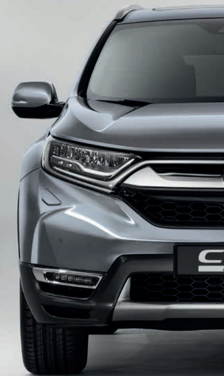
METALICKÁ LUNAR SILVER