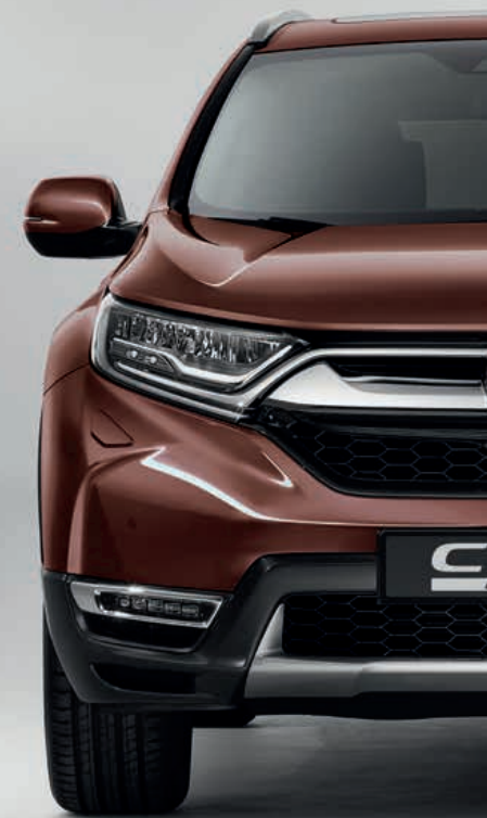
PERLEŤOVÁ PREMIUM AGATE BROWN