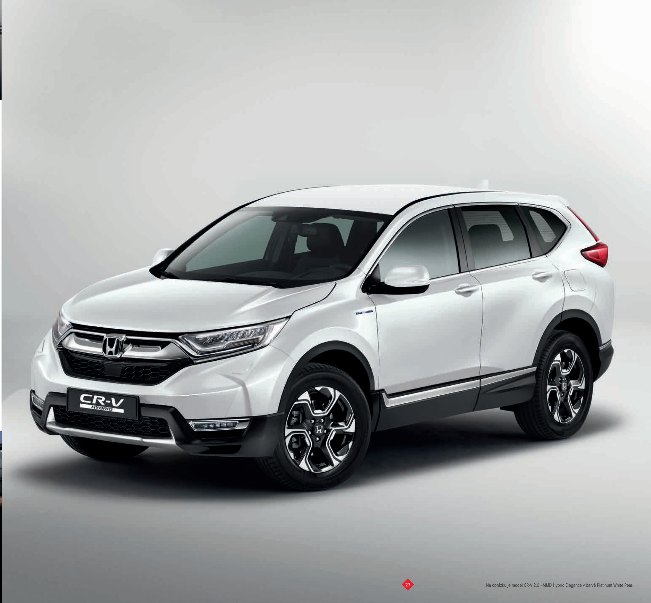
Na obrázku je model CR-V 2.0 i-MMD Hybrid Elegance v barvě Platinum White Pearl.