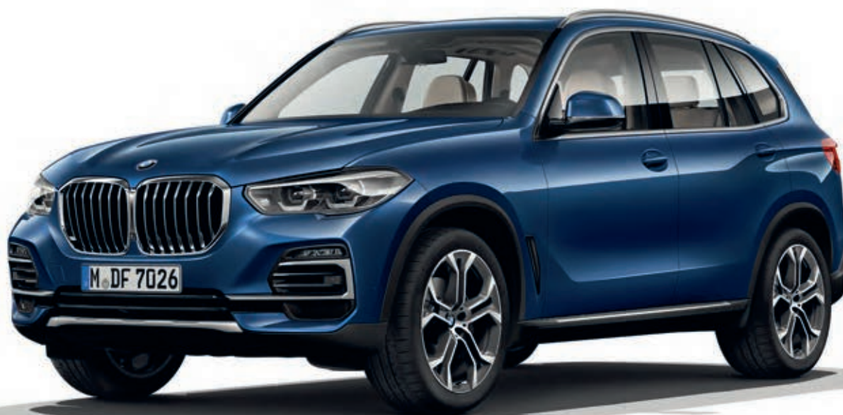
7HW - xLine - BMW X5 xDrive40i, metalický lak Phytonic Blue (volitelná výbava), 21" kola z lehké slitiny Y-spoke 744 (volitelná výbava)