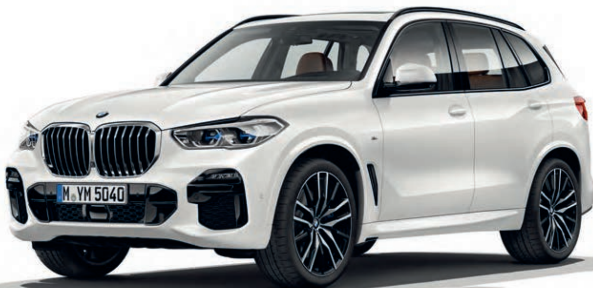
337 - M sportovní paket - BMW X5 xDrive40i, metalický lak Mineral White (volitelná výbava), 22" M kola z lehké slitiny Double-spoke 742 M (volitelná výbava)