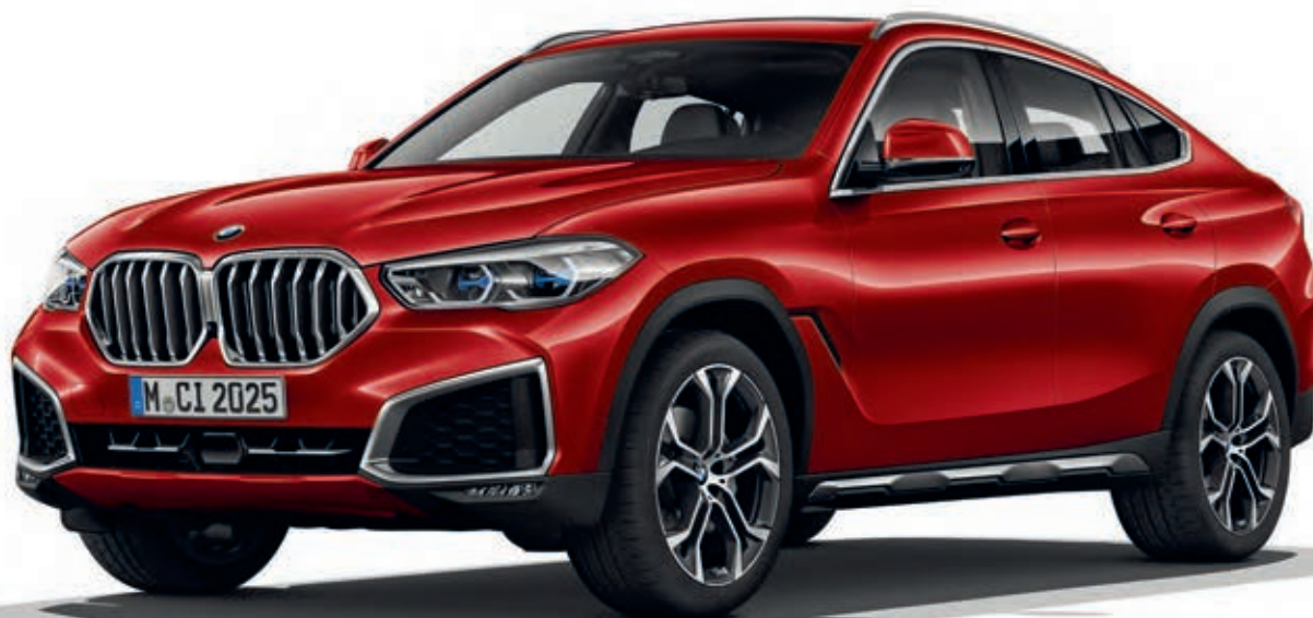
7HW - xLine - BMW X6 xDrive40i, metalický lak Flamenco Red (volitelná výbava), 21" kola z lehké slitiny Y-spoke 744 (volitelná výbava)