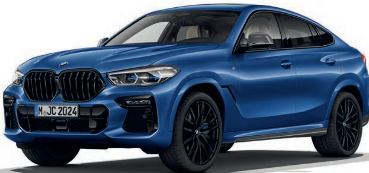
337 - M sportovní paket - BMW X6 xDrive40i, metalický lak Riverside Blue (volitelná výbava), 22" M kola z lehké slitiny Double-spoke 742 M, Jet Black (volitelná výbava), BMW Individual high-gloss Shadow Line s rozšířeným obsahem (volitelná výbava), M karbonové kryty vnějších zpětných zrcátek (volitelná výbava)