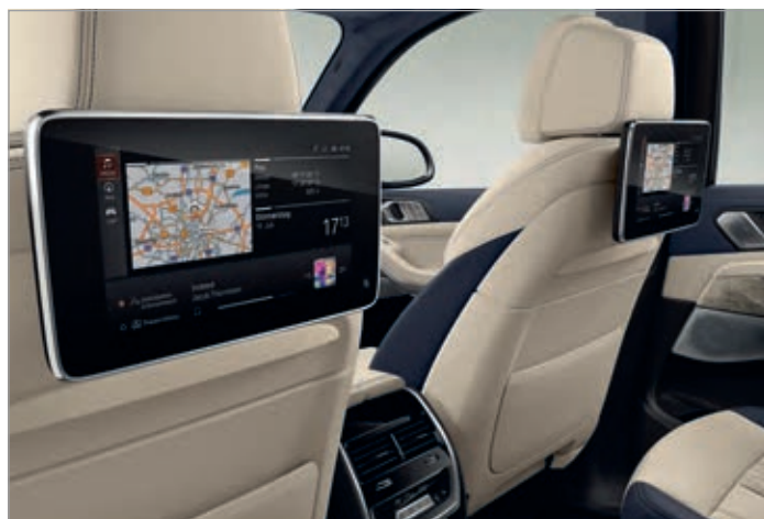
6FH – Zadní zábavní systém Professional

Obrázky jsou ilustrativní. Změny v obsahu, jakož i tiskové chyby a omyly jsou vyhrazeny.