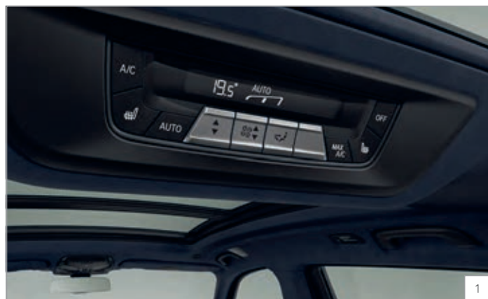
4NN – 5zónová automatická klimatizace