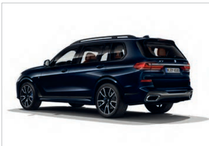
BMW X7 xDrive40i, BMW Individual high-gloss Shadow Line a koncovky výfuku specifické pro M sportovní paket

Obrázky jsou ilustrativní. Změny v obsahu, jakož i tiskové chyby a omyly jsou vyhrazeny.