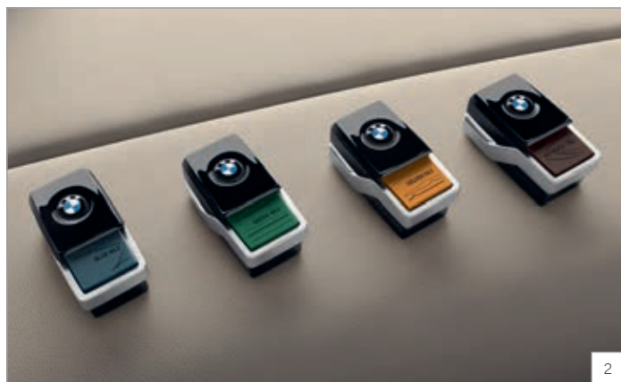
4NM – Paket Ambient Air

Obrázky jsou ilustrativní. Změny v obsahu, jakož i tiskové chyby a omyly jsou vyhrazeny.