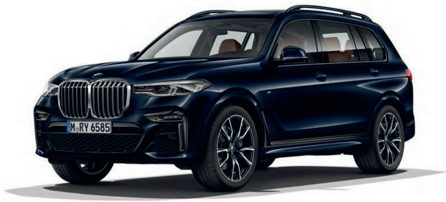
BMW X7 xDrive40i, Carbon Black (černá) (volitelná výbava), 22" M kola z lehké slitiny V-spoke 755 M (volitelná výbava)