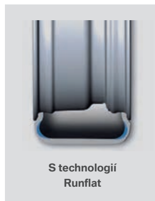
S technologií Runflat

Perfektní jízdní vlastnosti i v případě úplné ztráty tlaku.