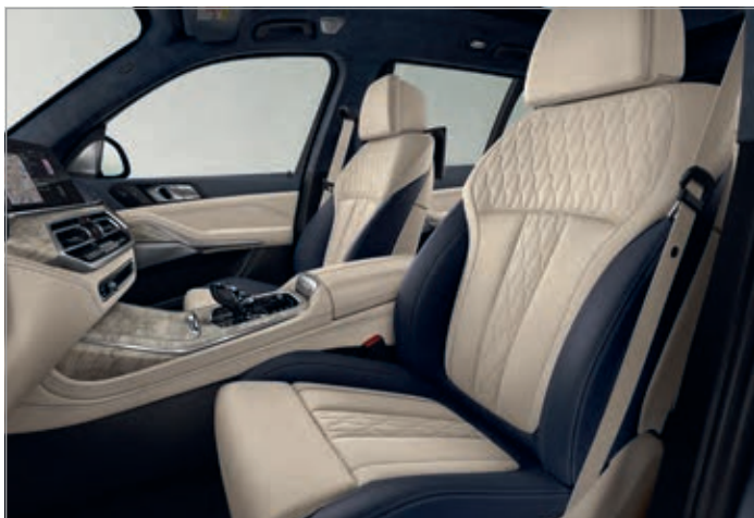
BMW Individual kůže Merino s rozšířeným obsahem "Ivory White / Night Blue" (volitelná výbava), BMW Individual obložení interiéru z jasanu, vysoce lesklé (volitelná výbava)