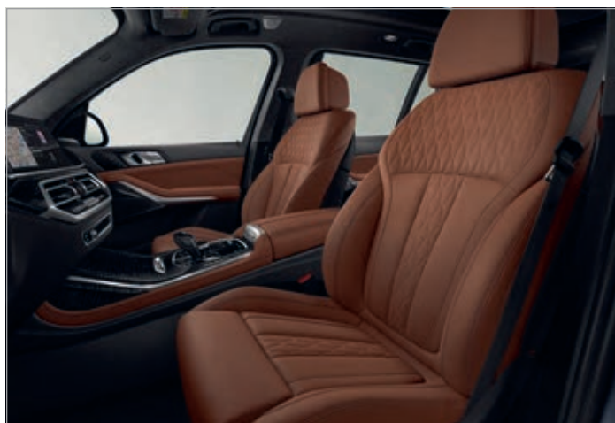
BMW Individual kůže Merino s rozšířeným obsahem "Tartufo / Black" (volitelná výbava), Dřevěné obložení interiéru Fineline Black s metalickým efektem, vysoce lesklé (volitelná výbava)