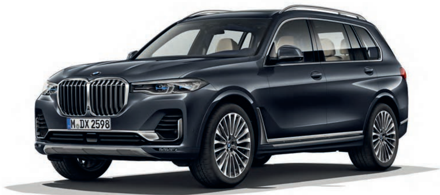
BMW X7 xDrive40i, Arctic Grey (šedá s brilantovým efektem) (volitelná výbava), 22" kola z lehké slitiny Multi-spoke 757 (volitelná výbava)