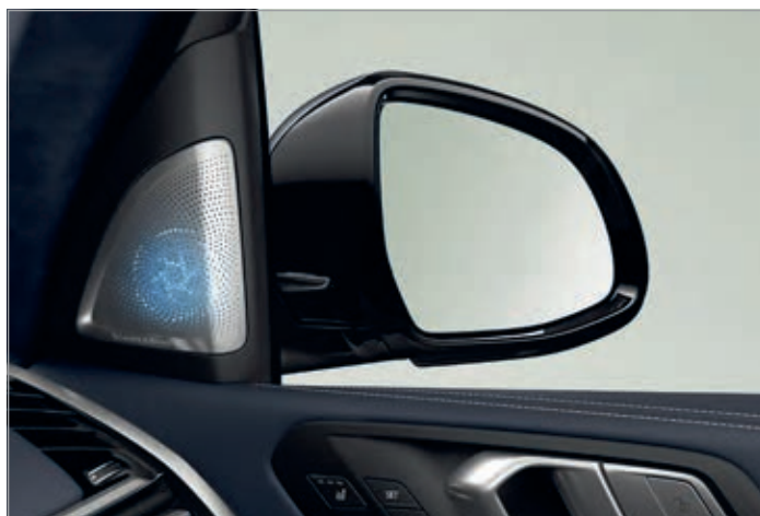
6F1 – Bowers & Wilkins Diamond Surround Sound Systém