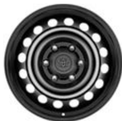
17" ocelové disky kol černá Standardně pro Extra Cab a Double Cab s výbavou Live Chassis a Live