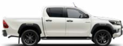
070 Bílá – perleťová** (není pro Single Cab)