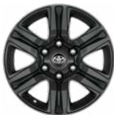
17" litá kola (6 paprsků) Standardně pro Double Cab s výbavou Active