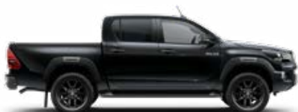
218 Černá – klasická*