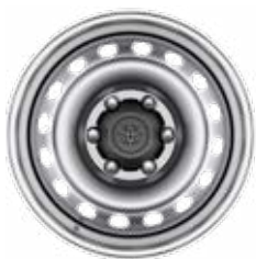
17" ocelové disky kol stříbrné Standardně pro Single Cab