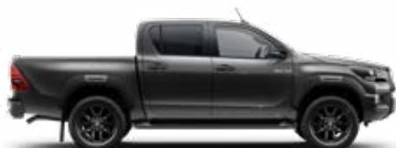
1G3 Šedá – popelavá*