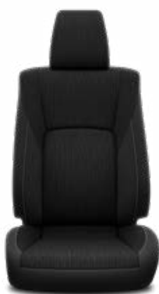
Černá látka Standardně pro výbavu Active a Executive