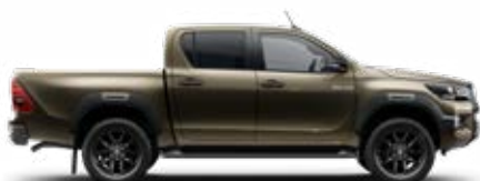
6X1 – Bronzovozelená – Jungle*