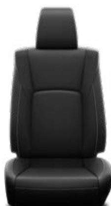
Černá přírodní/syntetická kůže Volitelně v paketu VIP