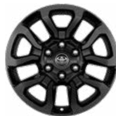
18" litá kola černá broušená (6 paprsků) Standardně pro Invincible a Invincible Sport