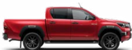
3T6 Červená – vulkanická*