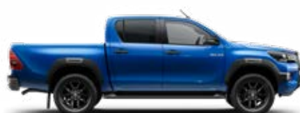
8X2 Modrá – vodní*