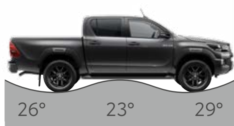
Zadní nájezdový úhel, Přechodový úhel, Přední nájezdový úhel