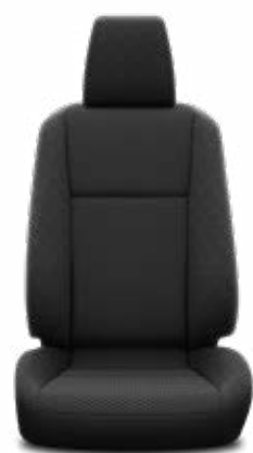
Černá látka Standardně pro výbavu Live Chassis a Live