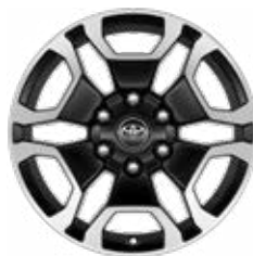
18" litá kola dvoubarevná šedá broušená (6 dvojitéch paprsků) Standardně pro Double Cab s výbavou Executive