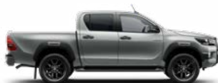
1D6 Stříbrná – zirkonová*