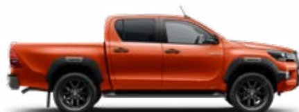
4R8 Oranžová – lávová*