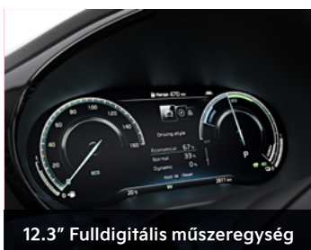
12.3" Fulldigitális műszeregység