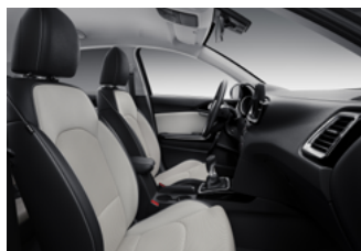
Felár nélkül választható műbőr/szövet kárpitozás X-SILVER, X-GOLD és X-PLATINUM felszereltséghez (CPA)