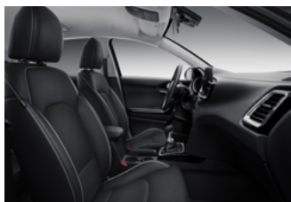
Felár nélkül választható műbőr/szövet kárpitozás X-SILVER, X-GOLD és X-PLATINUM felszereltséghez (CPB)