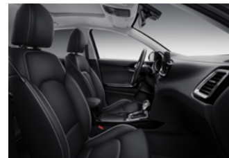
Opcionális BŐR csomag X-PLATINUM felszereltséghez