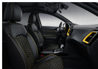
Opcionális YELLOW csomag műbőr/ textil kárpitozással X-GOLD és X-PLATINUM felszereltségekhez (CPE)