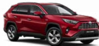
3T3 Červená – rubínová speciální lak 22 500 Kč