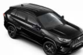
218 Černá – klasická metalický lak, vyobrazený model je dostupný pouze pro verzi Black Edition bez příplatku