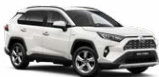
040 Bílá – čistá standardní lak bez příplatku