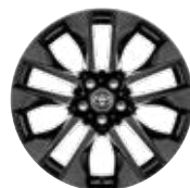
19" kola z lehkých slitin v černém designu, pneumatiky 225/55 R19 Pro výbavu Black Edition