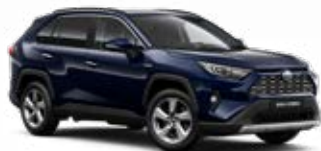
8X8 Modrá – temná metalický lak 15 000 Kč