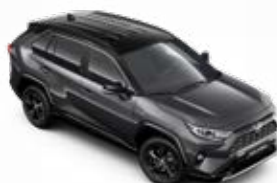
2QZ Šedá – popelavá se střechou v černé barvě metalický lak, dostupný pouze pro verzi Selection bez příplatku