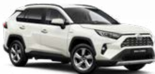
070 Bílá – perleťová perleťový lak 22 500 Kč