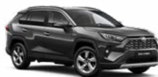
1G3 Šedá – popelavá metalický lak 15 000 Kč