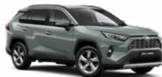
6X3 Zelená – Urban standardní lak 15 000 Kč