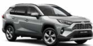
1D6 Stříbrná – zirkonová metalický lak 15 000 Kč