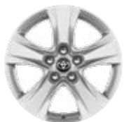
17" kola z lehkých slitin, pneumatiky 225/65 R17 Pro výbavu Comfort, paket Business (konvenční)