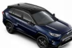
2RA Modrá – temná se střechou v černé barvě metalický lak, dostupný pouze pro verzi Selection bez příplatku