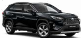
218 Černá – klasická metalický lak 15 000 Kč