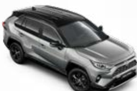
2QY Stříbrná – zirkonová se střechou v černé barvě metalický lak, dostupný pouze pro verzi Selection bez příplatku