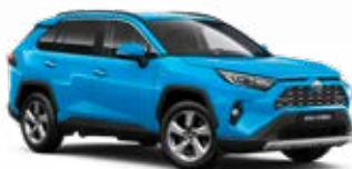
8W9 Modrá – azurová metalický lak 15 000 Kč