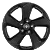
18" kola z lehkých slitin v černém designu, pneumatiky 225/60 R18 Pro výbavu Selection