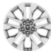
19" kola z lehkých slitin, pneumatiky 235/55 R19 nebo 225/55 R19 Pro výbavu Executive