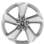
18" kola z lehkých slitin, pneumatiky 225/60 R18 Pro výbavu Style