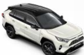
2QJ Bílá – perleťová se střechou v černé barvě perleťový lak, dostupný pouze pro verzi Selection bez příplatku