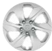
17" ocelové disky kol s ozdobnými kryty, pneumatiky 225/65 R17 Pro výbavu Active