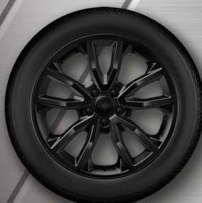
18" DISKY Z LEHKÝCH SLITIN – ČERNÉ Standard – Night Eagle