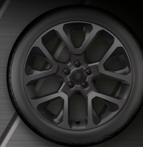
19" DISKY Z LEHKÝCH SLITIN Standard – S