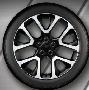
19" DISKY Z LEHKÝCH SLITIN Za příplatek – Limited