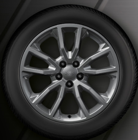
18" DISKY Z LEHKÝCH SLITIN Standard – Limited