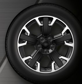
17" DISKY Z LEHKÝCH SLITIN Standard – Trailhawk