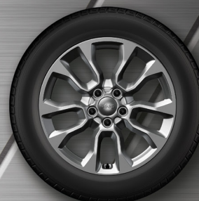
17" DISKY Z LEHKÝCH SLITIN Standard – Longitude