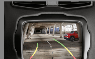
ZADNÍ PARKOVACÍ KAMERA S DYNAMICKY SE MĚNÍCÍ MŘÍŽKOU