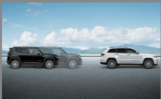
SYSTÉM VAROVÁNÍ PŘED ČELNÍM NÁRAZEM PLUS