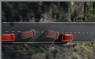
SYSTÉM SLEDOVÁNÍ JÍZDNÍHO PRUHU PLUS