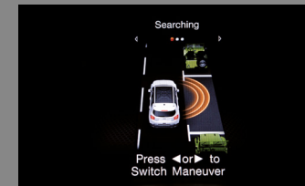
AUTOMATICKÝ PARKOVACÍ ASISTENT PARKSENSE