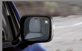
MONITOROVÁNÍ MRTVÝCH ÚHLŮ A DETEKCE PŘEKÁŽEK ZA VOZEM