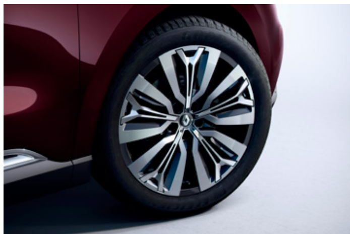
20" disky kol z lehkých slitin, design Initiale Paris