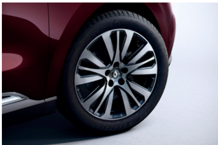
19" disky kol z lehkých slitin, design Initiale Paris