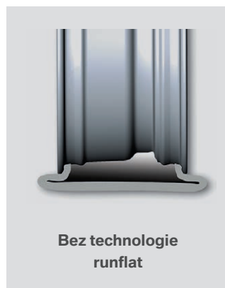
Bez technologie runflat

Pojištění v délce 36 měsíců začíná dnem zakoupení pneumatik od Vašeho BMW Servisního partnera. Budete si tak moci užívat naprosto bezstarostnou jízdu se zárukou dlouhé životnosti Vašich BMW Originálních pneumatik bez jakýchkoli dodatečných nákladů.