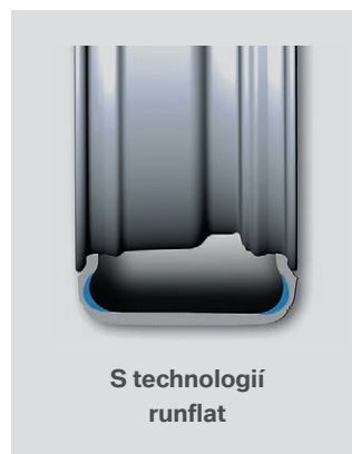
S technologií runflat

Perfektní jízdní vlastnosti i v případě úplné ztráty tlaku.