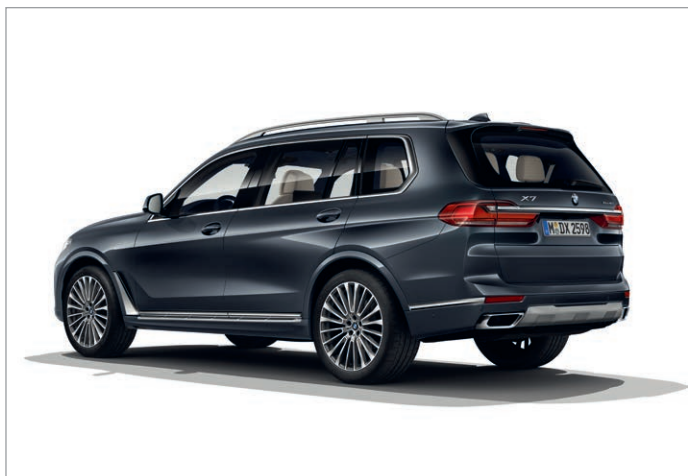
BMW X7 xDrive40i, zvýšená ochrana podvozku vpředu / vzadu (volitelná výbava)

Obrázky jsou ilustrativní. Změny v obsahu, jakož i tiskové chyby a omyly jsou vyhrazeny.