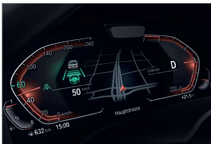
5AU – Driving Assistant Professional