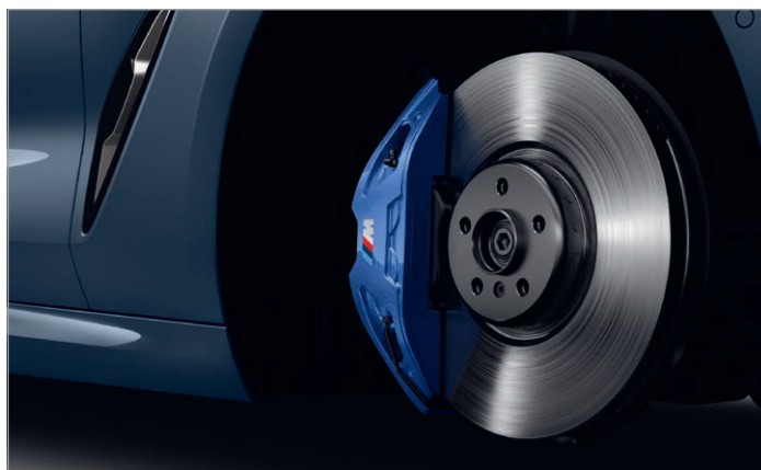
2NH – M sportovní brzdy