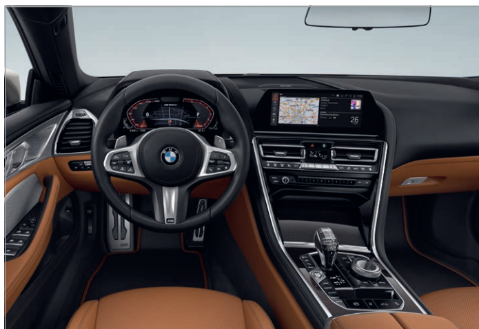
BMW Individual kůže Merino s rozšířeným obsahem "Cognac / Black", dřevěné obložení interiéru "Fineline" s měděným vysoce lesklým efektem