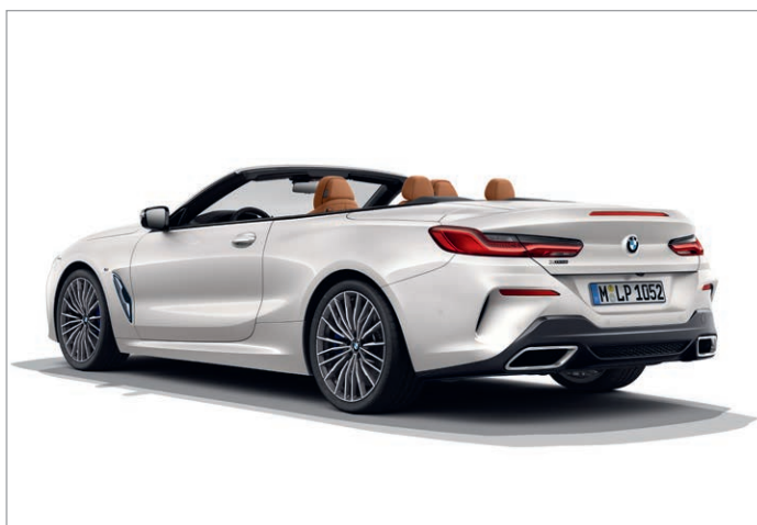
BMW 840d xDrive, zadní spodní nárazník s difuzorem v provedení Dark Shadow, koncovky výfuku světle chromované

Obrázky jsou ilustrativní. Změny v obsahu, jakož i tiskové chyby a omyly jsou vyhrazeny.