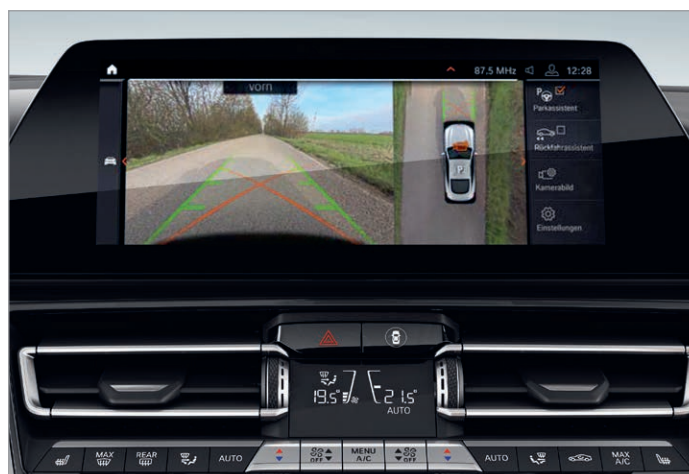
5DN – Parking Assistant Plus

Obrázky jsou ilustrativní. Změny v obsahu, jakož i tiskové chyby a omyly jsou vyhrazeny.