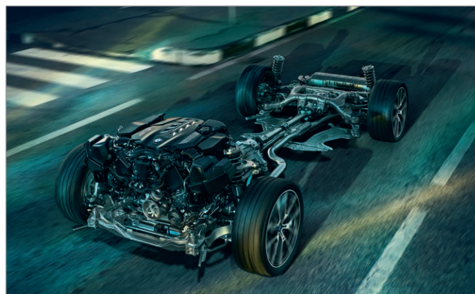
2VW – Adaptivní M podvozek Professional

Obrázky jsou ilustrativní. Změny v obsahu, jakož i tiskové chyby a omyly jsou vyhrazeny.