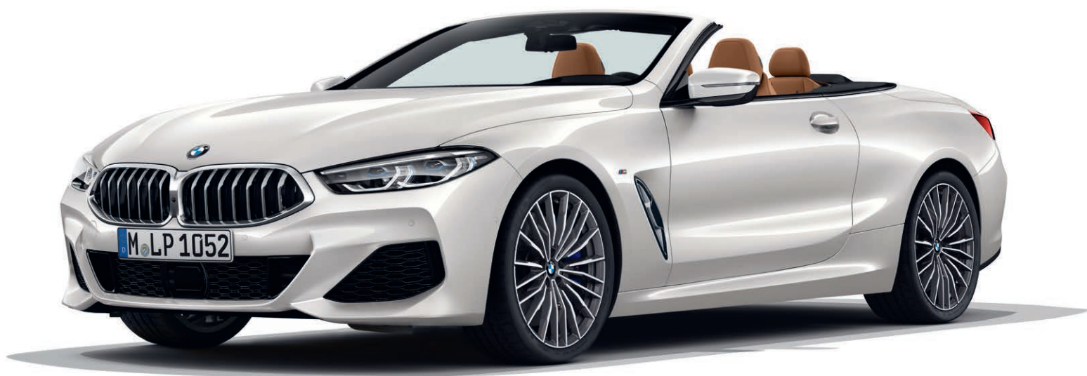
BMW 840d xDrive, volitelný metalický lak Mineral White (bílá), volitelná 20" M kola z lehké slitiny Multi-spoke 729 M Bicolour