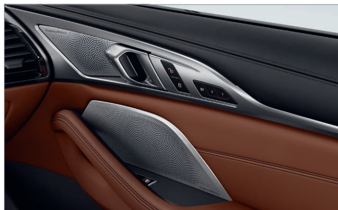
6F1 – Bowers &amp; Wilkins Diamond Surround Sound System