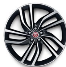
20" KOLA S 5 DVOJITÝMI PAPRSKY (STYLE 5036)