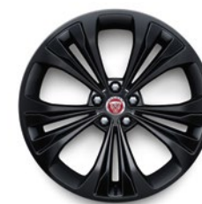
20" KOLA S 5 DVOJITÝMI PAPRSKY (STYLE 5107)