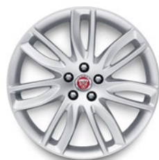
19" KOLA SE 7 DVOJITÝMI PAPRSKY (STYLE 7012)