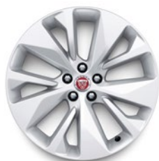
19" KOLA S 5 DVOJITÝMI PAPRSKY (STYLE 5106)