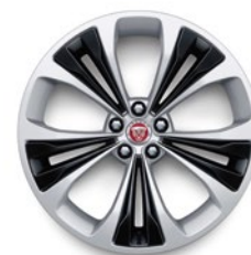
20" KOLA S 5 DVOJITÝMI PAPRSKY (STYLE 5107)