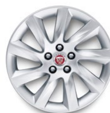
17" KOLA S 9 PAPRSKY (STYLE 9005) 1