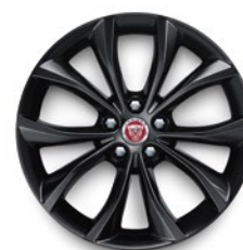
18" KOLA S 5 DVOJITÝMI PAPRSKY (STYLE 5033)