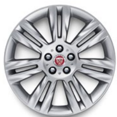
18" KOLA SE 7 DVOJITÝMI PAPRSKY (STYLE 7011)