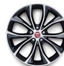
18" KOLA S 5 DVOJITÝMI PAPRSKY (STYLE 5033)