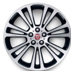
19" KOLA SE 7 DVOJITÝMI PAPRSKY (STYLE 7013)