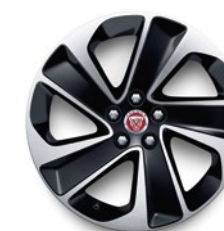
18" KOLA S 5 PAPRSKY (STYLE 5105)